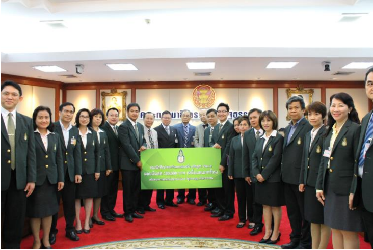
“คณะนักศึกษาศาสนาบ้านพระปกเกล้า หลักสูตร ปรม. ๑๔” สนับสนุนการเผยแพร่จุลสารรัฐธรรมนูญฉบับปฏิรูป