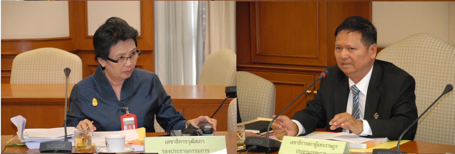
เลขาธิการวุฒิสภา รองประธานกรรมการ