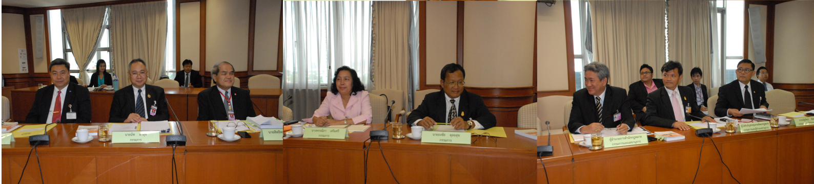
เลขาธิการสภาผู้แทนราษฎร ประธานกรรมการ