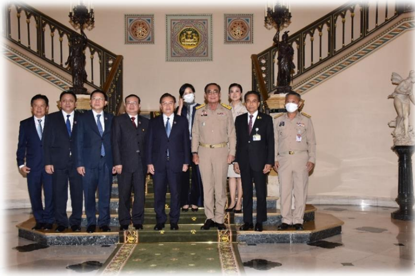
การเยี่ยมชมคารวะนายประยุทธ์ จันทร์โอชา นายกรัฐมนตรี และรัฐมนตรีว่าการกระทรวงกลาโหม