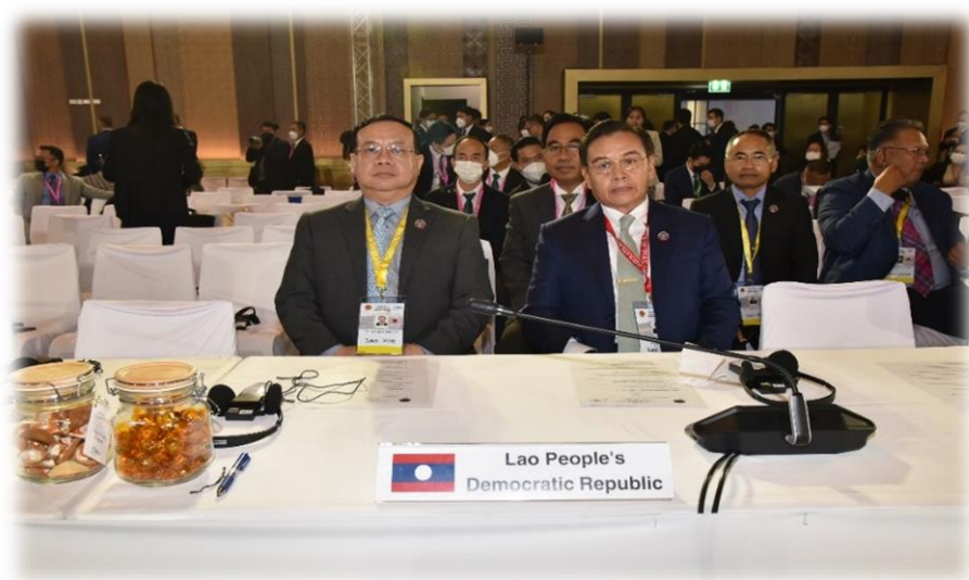
ประธานสภาแห่งชาติ สปป. ลาว เข้าร่วมพิธีปิดการประชุม APPF ครั้งที่ ๓๐

จากนั้น เวลา ๑๓.๓๐-๑๖.๐๐ นาฬิกา ร่วมรับฟังรายงานผลการดำเนินงานของ APPF (Chairman's Statement) และเข้าร่วมพิธีปิดการประชุมประจำปีรัฐสภาภาคพื้นเอเชียแปซิฟิก (APPF) ครั้งที่ ๓๐ โดยนายชวน หลีกภัย ประธานรัฐสภา ในฐานะประธานการประชุมประจำปีรัฐสภาภาคพื้นเอเชียแปซิฟิก (APPF) ครั้งที่ ๓๐ กล่าวสุนทรพจน์ปิดการประชุม ในการนี้ ประธานสภาแห่งชาติ สปป. ลาว ได้ลงนามในแถลงการณ์ร่วมร่วมกับหัวหน้าคณะประเทศต่าง ๆ ด้วย