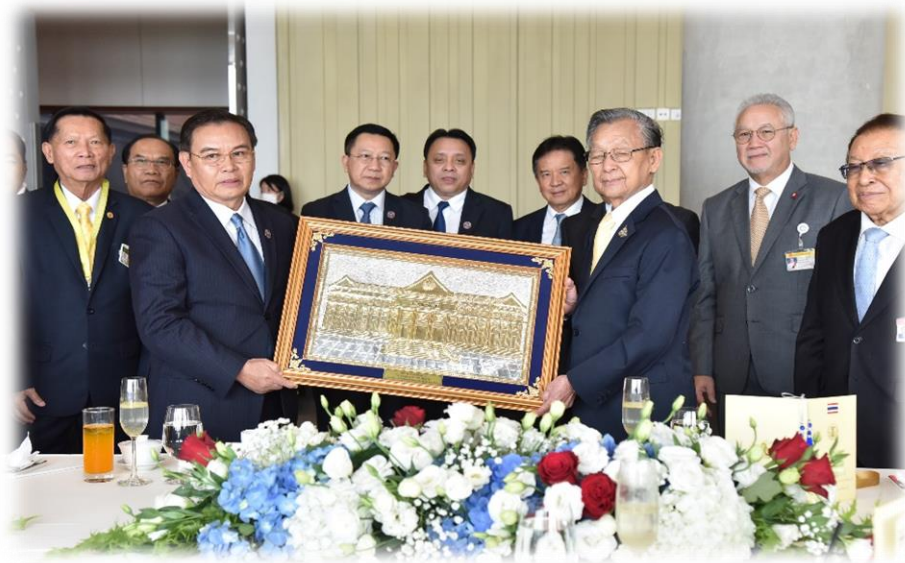
ประธานสภาแห่งชาติ สปป.ลาว มอบแผ่นเงินแกะสลักภาพอาคารสภาแห่งชาติ สปป.ลาว เป็นที่ระลึก