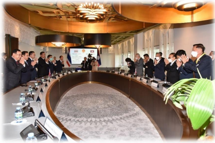
การพบปะหารือทวิภาคีระหว่างประธานรัฐสภาและประธานสภาผู้แทนราษฎร กับประธานสภาแห่งชาติ สปป.ลาว

ด้านประธานสภาแห่งชาติ สปป. ลาว ได้กล่าวขอบคุณประธานรัฐสภาและประธานสภาผู้แทนราษฎร ที่ให้การต้อนรับอย่างอบอุ่น รวมทั้งกล่าวแสดงเจตจำนงของตนที่จะมุ่งมั่นปฏิบัติหน้าที่เพื่อขยายความร่วมมือระหว่างรัฐสภาไทย-สภาแห่งชาติ สปป. ลาว โดยในระยะเวลาที่ผ่านมา ไทยกับสปป. ลาว ได้ร่วมมือกัน ดังนี้ (๑) การแก้ปัญหาการเดินทางเข้า-ออก ของประชาชนทั้งสองประเทศ ทั้งทางบก และน้ำ (๒) การค้าชายแดนไทย-สปป. ลาว ซึ่งปัจจุบันเกิดการขยายตัวเพิ่มขึ้น ร้อยละ ๑๔ จากปีก่อน ไทยเป็นคู่ค้าลำดับที่ ๑ ของ สปป. ลาว (๓) โครงการก่อสร้างถนนทางหลวง และสะพานมิตรภาพไทย-ลาว แห่งที่ ๕ (บึงกาฬ-บอลิคำไซ) จังหวัดบึงกาฬ เพื่อเชื่อมโยงรถไฟความเร็วสูงไทย-สปป. ลาว-จีน (๔) สนับสนุนการจัดทำข้อตกลงระหว่างรัฐสภาไทย-สภาแห่งชาติ สปป. ลาว ในการนำเข้าพลังงานไฟฟ้าจาก สปป. ลาว และ (๕) แก้ปัญหาแรงงานผิดกฎหมายเพื่อให้ได้รับสวัสดิการทางสังคม (๖) การแลกเปลี่ยนข้อมูลข่าวสารด้านนิติบัญญัติระหว่างรัฐสภาของทั้งสองประเทศ (๗) การสนับสนุน สปป. ลาว ในการเตรียมเป็นเจ้าภาพจัดการประชุมสมัชชารัฐสภาอาเซียน ครั้งที่ ๔๕