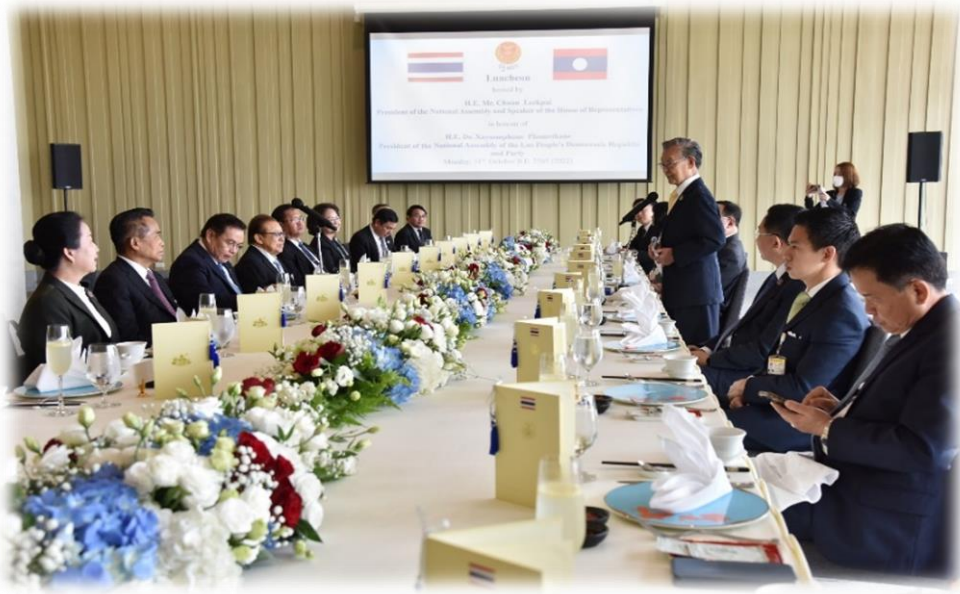
งานเลี้ยงอาหารกลางวัน โดย นายชวน หลีกภัย ประธานรัฐสภาและประธานสภาผู้แทนราษฎรเป็นเจ้าภาพ