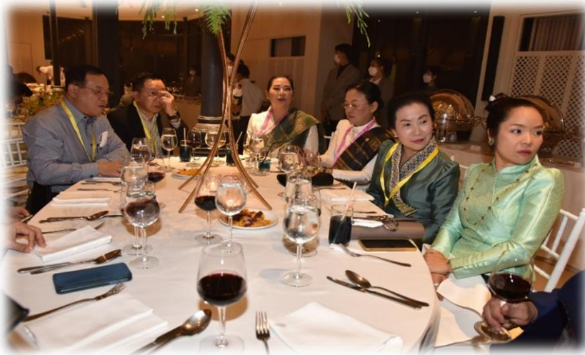
ดร.ไชสมพอน พมวิหาน ประธานสภาแห่งชาติ สปป. ลาว และคณะ เข้าร่วมงานเลี้ยงอำลา คณะผู้แทน APPF ครั้งที่ ๓๐ โดย ศาสตราจารย์พิเศษพรเพชร วิชิตชลราชัย ประธานวุฒิสภา เป็นเจ้าภาพ