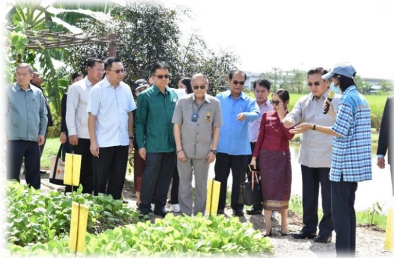
คณะผู้แทนสภาแห่งชาติ สปป.ลาว เยี่ยมชมแปลงเกษตรสาธิตของศูนย์บริการวิชาการเกษตรของมูลนิธิชัยพัฒนา