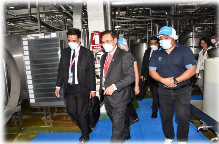
ดร.ไชสมพอน พมวิหาน ประธานสภาแห่งชาติ สปป. ลาว และคณะ เยี่ยมชมโรงงานผลิตน้ำกะทิออร์แกนิก บริษัท ไทยอกริฟูด จำกัด (มหาชน)