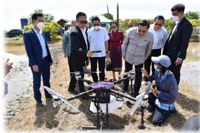
การสาธิตการใช้โดรนหว่านเมล็ดพันธุ์ข้าว