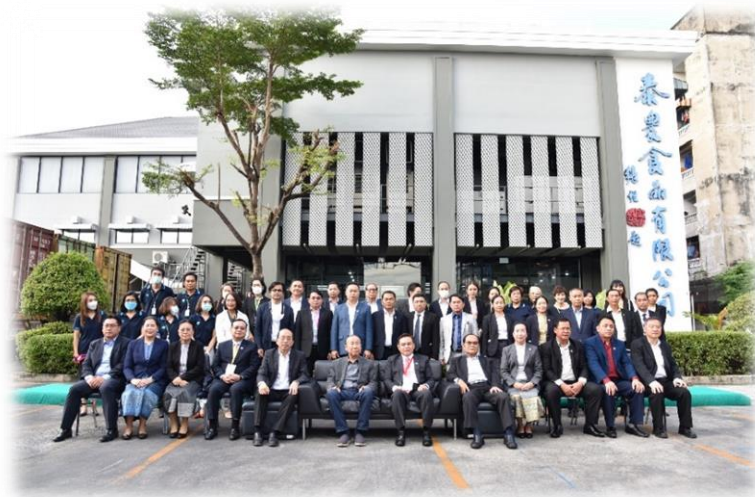
คณะเยือนร่วมถ่ายรูปเป็นที่ระลึกบริเวณหน้าบริษัท ไทยอกริฟูด จำกัด (มหาชน)