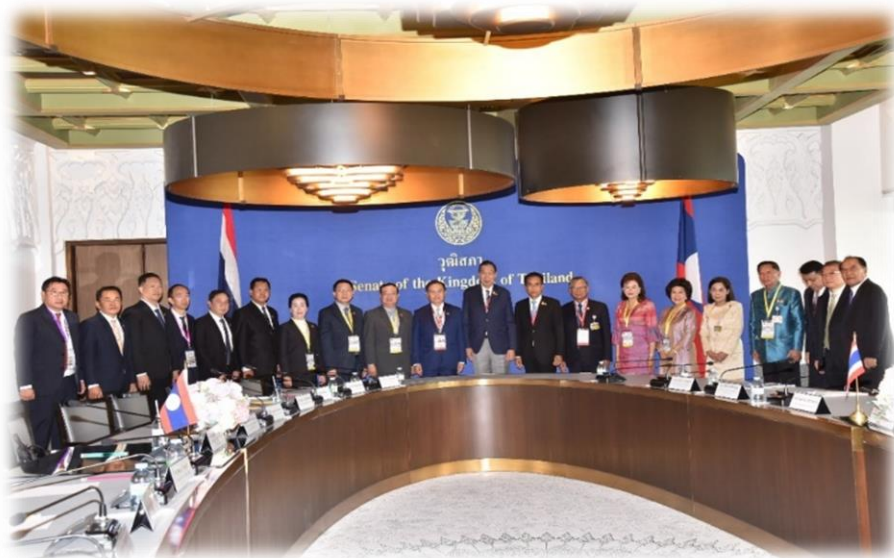
ดร. ไชยมพอน พมวิทาน ประธานสภาแห่งชาติ สปป. ลาว และคณะ ร่วมหารือทวิภาคี กับศาสตราจารย์พิเศษพรเพชร วิชิตชลชัย ประธานวุฒิสภา ณ ห้องรับรองพิเศษ ๒๐๓ ชั้น ๒ อาคารรัฐสภา (ฝั่ง สว.)

เวลา ๑๒.๑๐-๑๓.๐๐ นาฬิกา ประธานสภาแห่งชาติ สปป. ลาว และคณะเข้าร่วม งานเลี้ยงอาหารกลางวัน โดยกลุ่มมิตรภาพสมาชิกรัฐสภาไทย-ลาว เป็นเจ้าภาพ ณ ห้องจัดเลี้ยง เชียงใหม่ ชั้น ๘ โรงแรมแกรนด์ไฮน่า