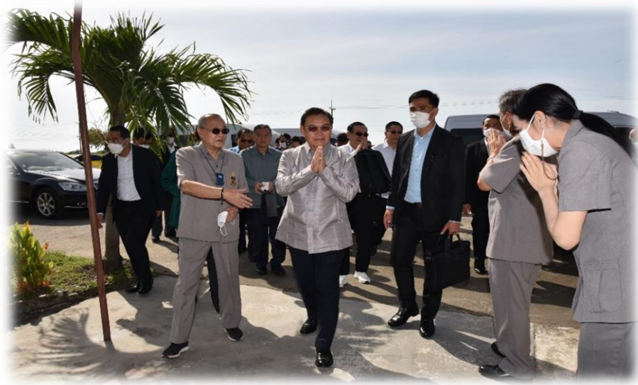
ดร. สุเมธ ตันติเวชกุล เลขาธิการมูลนิธิชัยพัฒนา ให้การต้อนรับ ดร. ไชสมพอน พมวิทาน ประธานสภาแห่งชาติ สปป.ลาว และคณะ