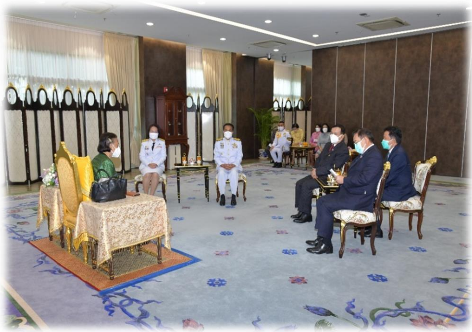
สมเด็จพระกนิษฐาธิราชเจ้า กรมสมเด็จพระเทพรัตนราชสุดาฯ สยามบรมราชกุมารี พระราชทานพระบรมราชวโรกาสให้ นายไชสมพอน พมวิทาน ประธานสภาแห่งชาติสาธารณรัฐประชาธิปไตยประชาชนลาว และคณะ เข้าเฝ้าทูลละอองพระบาท ณ วังสระปทุม