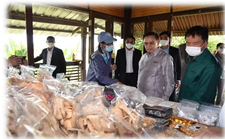
คณะเข้าเยี่ยมชมร้านจำหน่ายผลิตภัณฑ์เกษตรแปรรูป