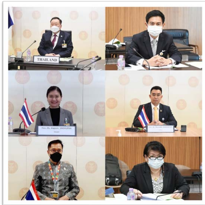
คณะผู้แทนรัฐสภาไทยขณะเข้าร่วมประชุม ASEP ครั้งที่ ๑๑

สรุปผลการประชุมโดย กลุ่มงานกิจการพิเศษ สำนักองค์การรัฐสภาระหว่างประเทศ สำนักงานเลขาธิการสภาผู้แทนราษฎร