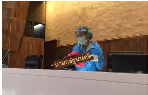
การทำความสะอาด (Big Cleaning) ภายในอาคารรัฐสภา