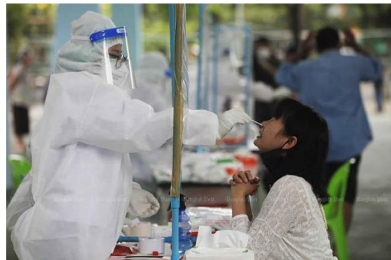
บุคลากรทางการแพทย์ให้บริการตรวจคัดกรองผู้สัมผัสผู้ป่วยยืนยันโรคโควิด-๑๙