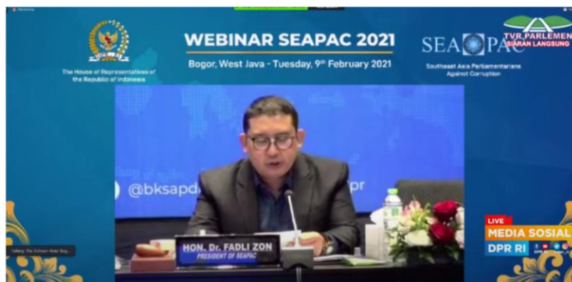
ดร. Fadli Zon สมาชิกวุฒิสภาอินโดนีเซีย และประธาน SEAPAC กล่าวเปิดการสัมมนา

เอเชียตะวันออกเฉียงใต้ต่อไป และขอความร่วมมือประเทศหรือสมาชิกรัฐสภาที่ยังไม่ได้เข้าร่วมกับ SEAPAC เข้าร่วมสมัครเป็นสมาชิก SEAPAC เพื่อร่วมมือกันต่อต้านการทุจริตต่อไป