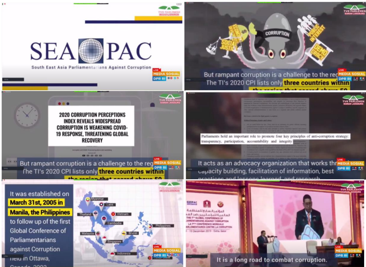
คลิปวิดีโอทัศน์และนางองค์การ SEAPAC

ก่อนเริ่มต้นช่วงการอภิปรายได้มีการฉายคลิปวิดีโอทัศน์และนางองค์การ SEAPAC ซึ่งเป็นเครือข่ายความร่วมมือของสมาชิกรัฐสภาเพื่อการต่อต้านการทุจริตในภูมิภาคเอเชียตะวันออกเฉียงใต้ มีจุดมุ่งหมายร่วมกันในการต่อต้านการทุจริตและการเสริมสร้างธรรมาภิบาล โดยมีข้อผูกพันที่จะต่อต้านการทุจริตและส่งเสริมความโปร่งใสและการตรวจสอบได้ เพื่อสร้างมาตรฐานที่มีคุณภาพในการบูรณาการการจัดการภาครัฐและธรรมาภิบาล SEAPAC เชื่อมันว่ารัฐสภาเป็นกลไกดำเนินการที่สำคัญที่จะส่งเสริมยุทธศาสตร์และแผนดำเนินการเชิงรุก ตลอดจนการดำเนินการอย่างเหมาะสมเพื่อบรรลุด้านภาพที่ยั่งยืนในบริบทสังคมระหว่างประเทศ ปัจจุบัน SEAPAC มีประเทศสมาชิกที่มีหน่วยประจำชาติ จำนวน ๔ ประเทศ ได้แก่ อินโดนีเซีย มาเลเซีย ฟิลิปปินส์ และติมอร์เลสเต มีสำนักงานเลขาธิการตั้งอยู่ที่กรุงจาการ์ตา สาธารณรัฐอินโดนีเซีย