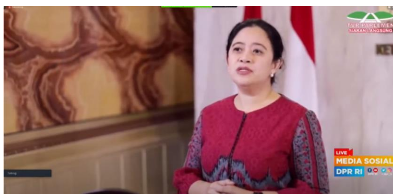
ดร. H.C. Puan Maharani ประธานสภาผู้แทนราษฎรอินโดนีเซีย กล่าวเปิดการสัมมนา

จากนั้นเป็นการฉายคลิปวิดีโอที่ศันคำกล่าวเปิดประชุมโดย ดร. H.C. Puan Maharani ประธานสภาผู้แทนราษฎรอินโดนีเซีย มีสาระสำคัญเกี่ยวกับบทบาทและหน้าที่ของสมาชิกรัฐสภา ที่เป็นพันธมิตรร่วมมือกันในภูมิภาคเอเชียตะวันออกเฉียงใต้ด้านการต่อต้านการทุจริต ทั้งนี้ การทุจริตสามารถเกิดขึ้นได้ทุกที่ทุกเวลา สมาชิกวุฒิสภาจำเป็นต้องแสดงบทบาทอย่างจริงจังและเข้มแข็งในการต่อต้านการทุจริตและจัดการผลกระทบที่จะเกิดต่อประชาชน ซึ่งอาจกระทบต่อโอกาสทางเศรษฐกิจและธรรมาภิบาลเช่นกัน ทั้งนี้ในระดับโลก สมาชิกวุฒิสภาถือเป็นกลไกหลักที่จะร่วมมือกันอย่างจริงจังเพื่อต่อต้านการทุจริต เช่นเดียวกับในระดับประเทศ รัฐสภาอินโดนีเซียเป็นกลไกสำคัญเพื่อแสดงพลังการสนับสนุนในการต่อต้านการทุจริต และส่งเสริมความร่วมมือระหว่างประเทศที่จะร่วมกันพัฒนาโลก ในวาระของการประชุม UNGASS 2021 ว่าด้วยการต่อต้านการทุจริตที่จะจัดขึ้นในเดือนมิถุนายน ๒๕๖๔ นับเป็นโอกาสอันดีที่สมาชิกรัฐสภาทั่วโลกจะร่วมกันสนับสนุนอย่างแข็งขัน ทั้งนี้ วิกฤตการแพร่ระบาดของโรคติดเชื้อไวรัสโคโรนา ๒๐๑๙ ส่งผลให้รัฐบาลในหลายประเทศเร่งรัดดำเนินการด้านงบประมาณเพื่อฟื้นฟูเศรษฐกิจ ซึ่งอาจมีผลกระทบที่ตามมาจากการใช้งบประมาณในทางที่ผิดหรือเกิดการทุจริตขึ้นได้ ดังนั้น รัฐสภาจำเป็นต้องดำเนินการเพื่อตรวจสอบการบริหารของภาครัฐ โดย (๑) สร้างความเข้มแข็งในการตรวจสอบการทำงานของฝ่ายบริหาร (๒) สร้างความโปร่งใสตรวจสอบได้ และ (๓) สร้างธรรมาภิบาลทั้งภาคส่วนรัฐบาลและเอกชน เพื่อขยายการบูรณาการในการจัดการปัญหาโรคโควิด-๑๙ ดังนั้น SEAPAC จะเป็นเวทีในการแบ่งปันแนวคิดและประสบการณ์เพื่อสร้างแนวทางในการต่อต้านการทุจริตร่วมกันในภูมิภาคในช่วงเวลาดังกล่าว