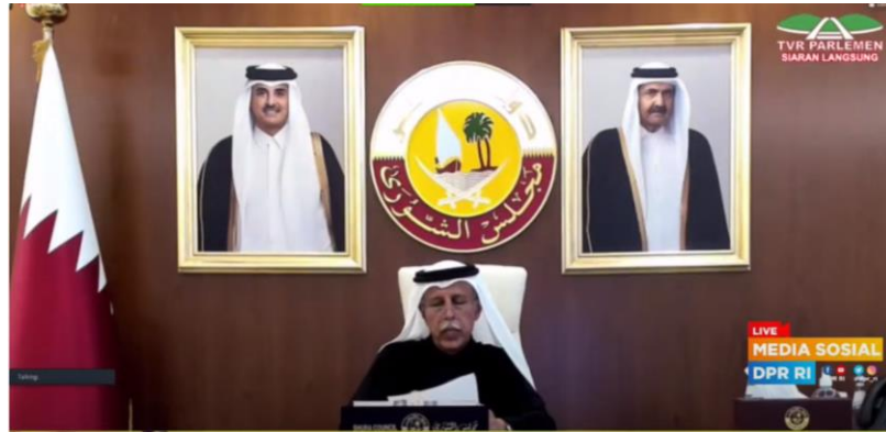
นาย Ahmad Bin Abdulla bin Zaid Al-Mahmoud สมาชิกรัฐสภา ประธาน GOPAC และประธานสภา Shura แห่งรัฐกาตาร์ กล่าวเปิดการสัมมนา

ประเทศชาติอย่างเต็มที่ อีกทั้งเพื่อเป็นการสร้างความมั่นคงสืบต่อไปในอนาคตเพื่อคนรุ่นถัดไป ดังนั้น จึงจำเป็นต้องร่วมมือกันส่งเสริมพลังผลักดันให้สมาชิกรัฐสภาสนับสนุนให้เกิดกระแสความเปลี่ยนแปลงในการต่อต้านการทุจริตในสังคม โดยที่ GOPAC SEAPAC และหน่วยประจำชาติในภูมิภาคต่าง ๆ จะผนึกกำลังร่วมมือกันเพื่อสร้างเครือข่ายความร่วมมือในการทำงานและสร้างพันธมิตร เพื่อส่งเสริมภารกิจของฝ่ายนิติบัญญัติให้ก้าวหน้าและทันต่อยุคสมัยในอนาคต