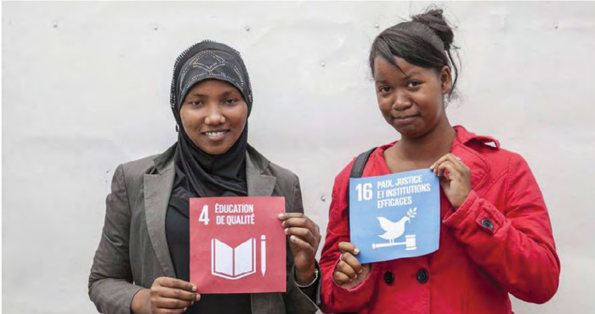
โครงการพัฒนาแห่งสหประชาชาติ ประเทศมาดากัสการ์ เป้าหมายระดับโลกนำเสนอโดยกลุ่มเยาวชนระหว่างการประชุม Social Good Summit ที่มาดากัสการ์เมื่อกันยายน พ.ศ. 2558 ที่ผ่านมา