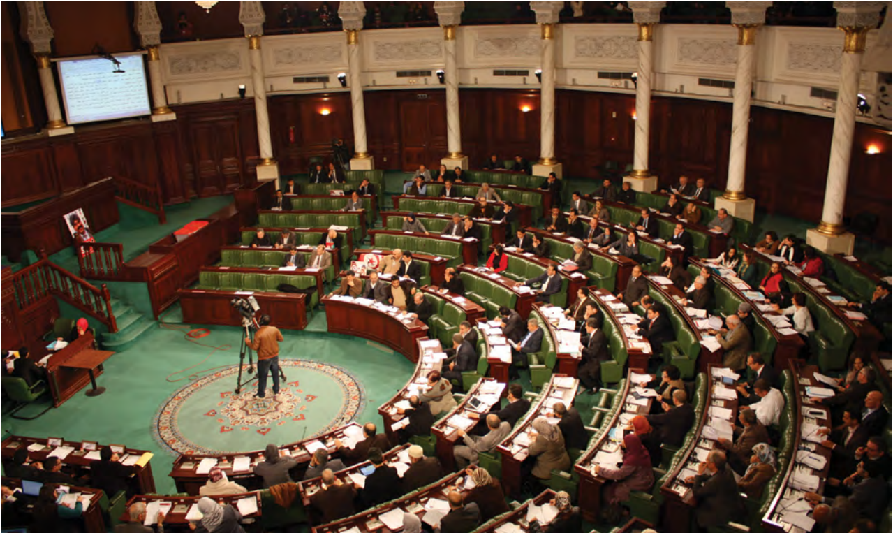
โครงการพัฒนาแห่งสหประชาชาติ ประเทศตูนิเซีย

การหารือเกี่ยวกับรัฐธรรมนูญของตูนิเซีย วันที่ 20 มกราคม พ.ศ. 2557