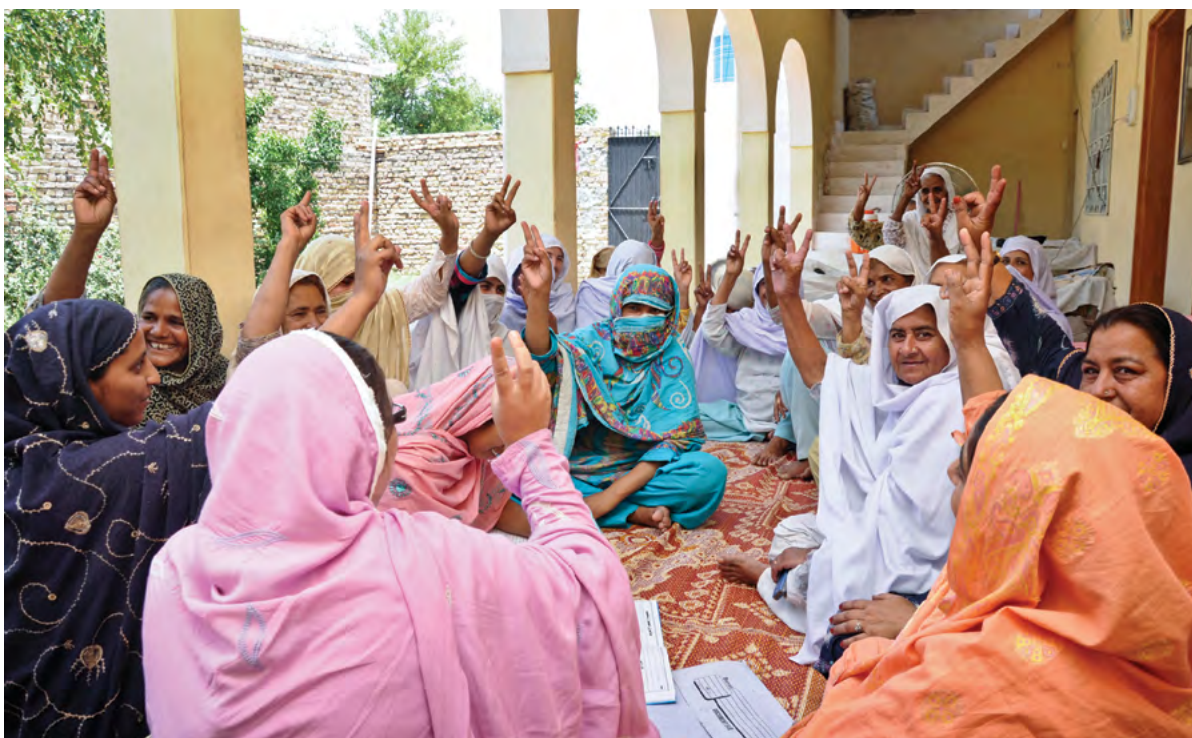
โครงการพัฒนาแห่งสหประชาชาติ ประเทศปากีสถาน

ด้านล่างนี้คือวิธีบางประการที่รัฐสภาสามารถใช้ดำเนินการเพื่อให้มั่นใจว่าการนำเป้าหมายการพัฒนาที่ยั่งยืนไปใช้นั้นจะมีการประสานกับรัฐบาลย่อยและรัฐบาลระดับท้องถิ่น โดยที่ประชาชนทั่วประเทศก็ได้มีส่วนร่วมออกความคิดเห็นด้วย