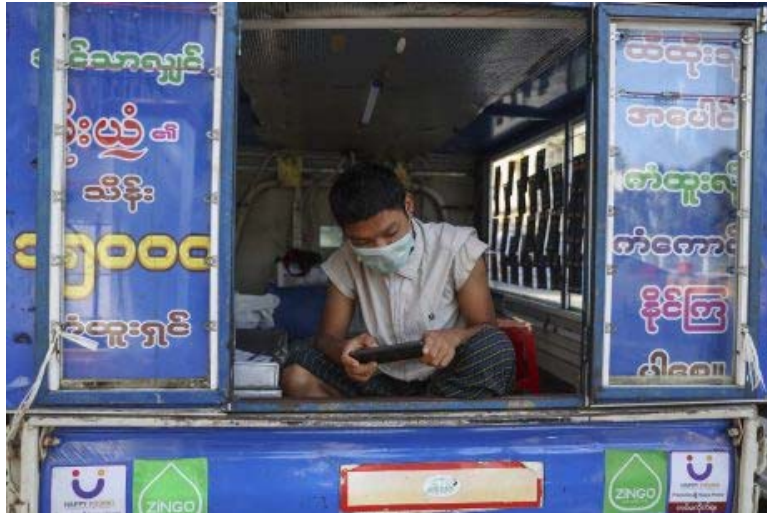
ผู้ชายถือเตอร์สวมหน้ากากอนามัยเพื่อป้องกันการแพร่ระบาดของโรคโควิด-๑๙ ในกรุงย่างกุ้ง เมียนมา