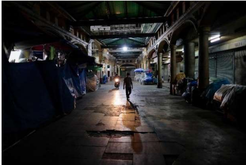
ร้านค้าปิดทำการในช่วงเวลาเคอร์ฟิวในกรุงเทพมหานคร