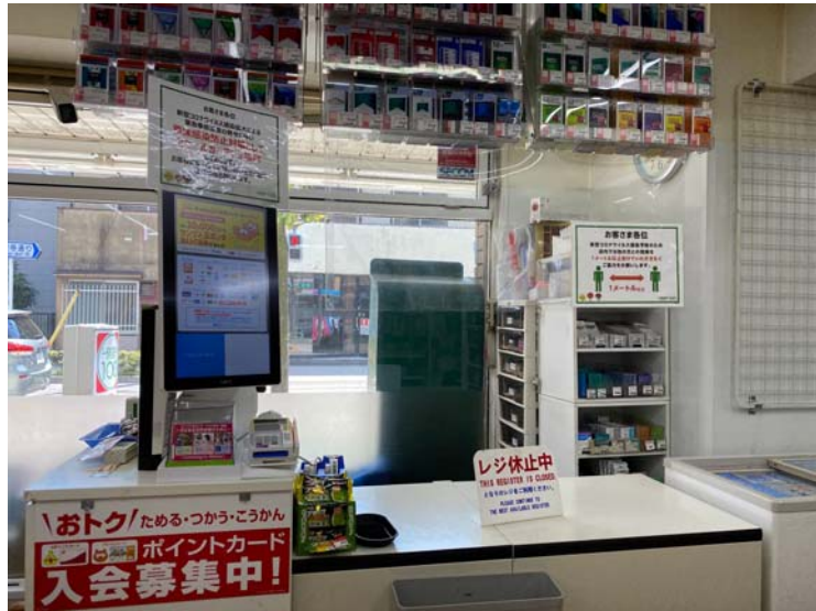
ป้ายขอความร่วมมือลูกค้ายืนห่างกัน ๑ เมตร ในร้านโลว์สัน ประเทศญี่ปุ่น