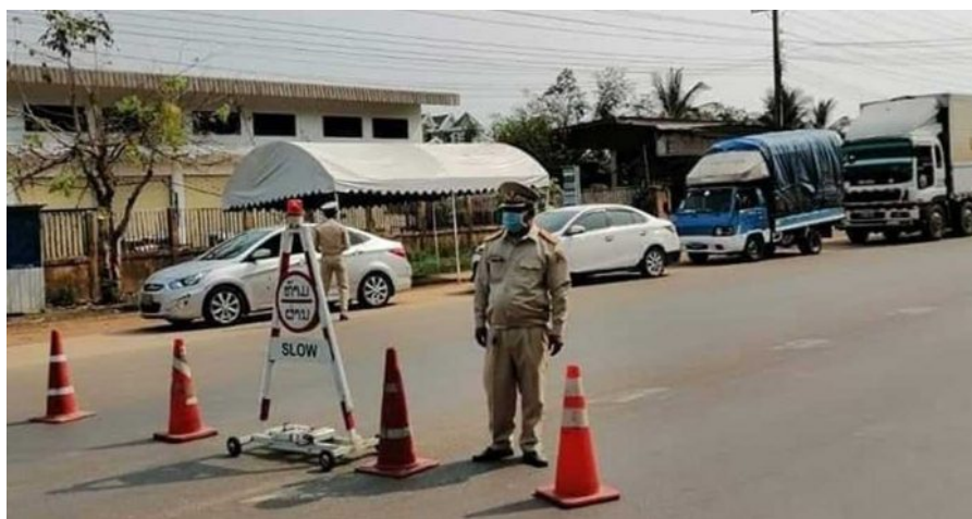
การล็อกดาวน์ในสาธารณรัฐประชาธิปไตยประชาชนลาว ที่มา : เว็บไซต์ The Lao Times