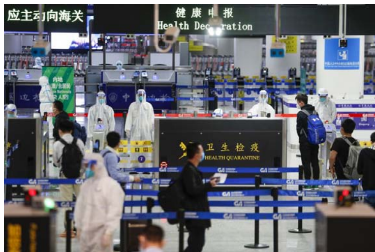
เจ้าหน้าที่ศุลกากรตรวจสอบข้อมูลสุขภาพของผู้เดินทางเข้าประเทศจีน