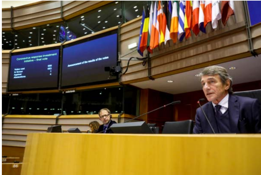
การลงคะแนนเสียงเพื่อให้ความเห็นชอบมาตรการช่วยเหลือฉุกเฉินของสหภาพยุโรป