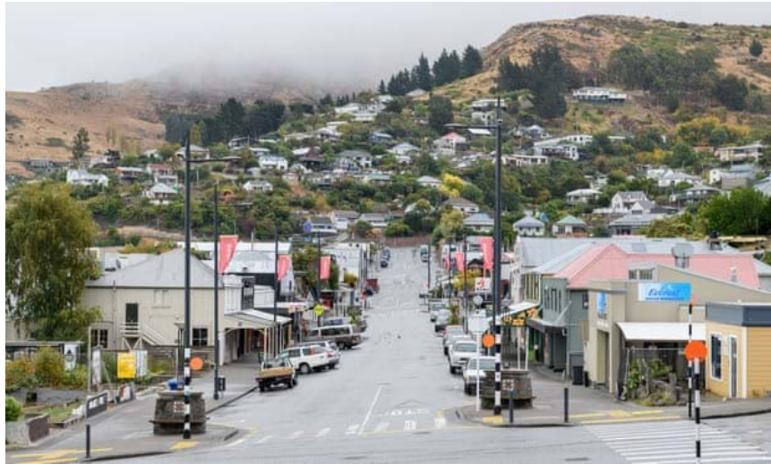
ถนนว่างเปล่าในประเทศนิวซีแลนด์เนื่องจากมาตรการล็อกดาวน์