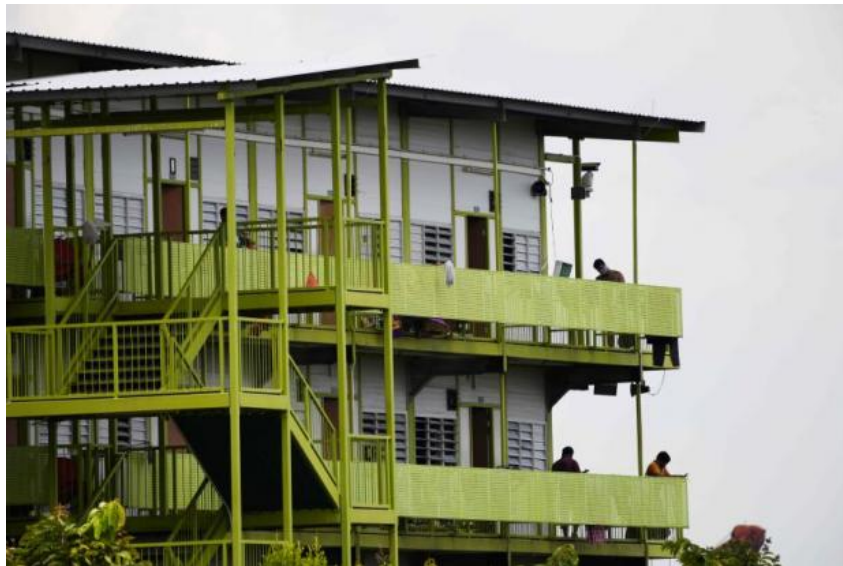
ผู้อาศัยพักอยู่ที่หอพักคนงานชาวต่างชาติภายใต้มาตรการป้องกันการแพร่ระบาดของโรคโควิด-๑๙ ในประเทศสิงคโปร์