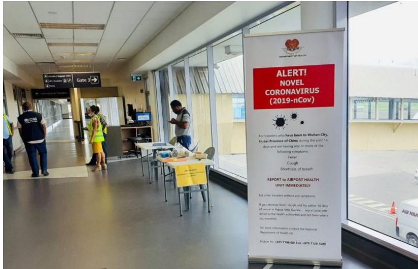
การเฝ้าระวังการแพร่เชื้อไวรัสโคโรนา ๒๐๑๙ ที่สนามบินนานาชาติปาปัวนิวกินี