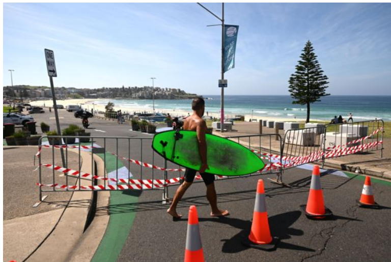
ชายหาดในประเทศออสเตรเลียถูกปิดในช่วงการแพร่ระบาดของโรคโควิด-๑๙