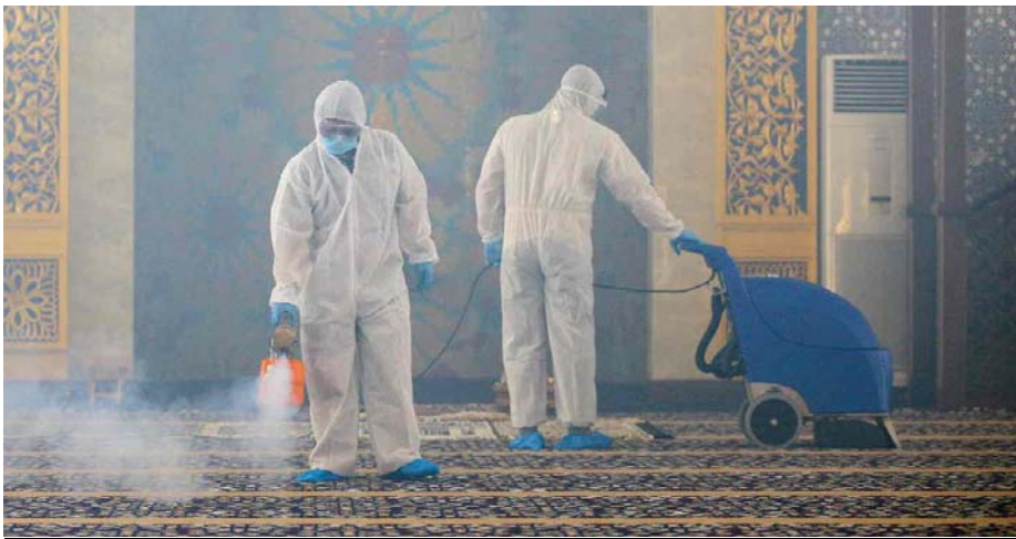
การฉีดพ่นน้ำยาฆ่าเชื้อที่มัสยิดเพื่อป้องกันการแพร่ระบาดของโรคโควิด-๑๙ ในกรุงบันดาร์เสรีเบกาวัน บรูไนดารุสซาลาม