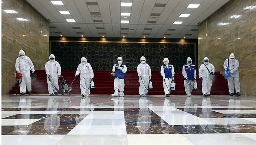
การฉีดพ่นน้ำยาฆ่าเชื้อซึ่งเป็นหนึ่งในมาตรการป้องกันโรคโควิด-๑๙ ในประเทศเกาหลีใต้