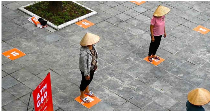
ประชาชนสวมหน้ากากอนามัยยืนเว้นระยะห่างระหว่างกัน ตามมาตรการรักษาระยะห่างทางสังคม (Social Distancing) ขณะเข้าแถวรับแจกข้าวสารในกรุงฮานอย