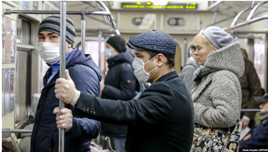
ประชาชนสวมหน้ากากผ้าขณะโดยสารรถไฟฟ้าใต้ดินในกรุงมินสค์ ประเทศเบลารุส