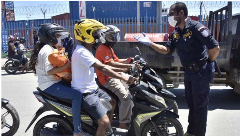
ตำรวจในเมืองดิลีขอให้ผู้ขับขี่จักรยานยนต์ซ้อนท้ายได้เพียงคนเดียว เพื่อรักษาระยะห่างทางสังคม