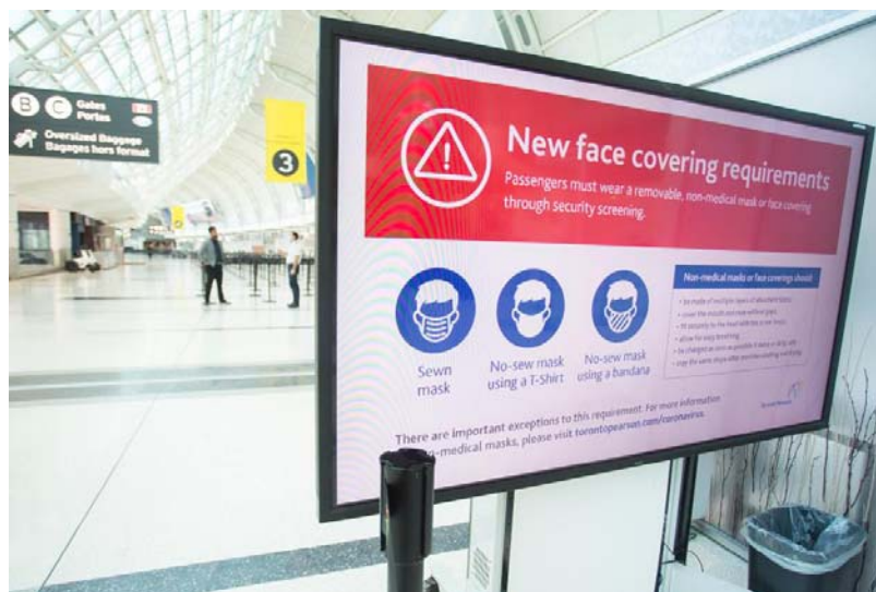
ป้ายขอความร่วมมือให้สวมหน้ากากอนามัยในช่วงการแพร่ระบาดของโรคโควิด-๑๙