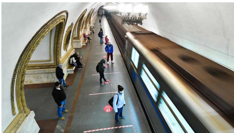
รัสเซียยกระดับมาตรการเพื่อลดการแพร่ระบาดของเชื้อโคโรนาไวรัส