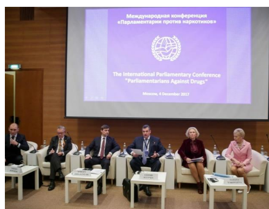
ภาพบรรยากาศการประชุมกลุ่มย่อยภายใต้การประชุมรัฐสภาระหว่างประเทศว่าด้วยการต่อต้านยาเสพติด