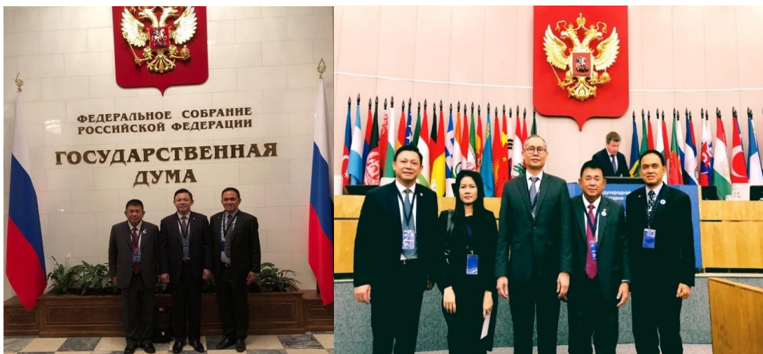
คณะผู้แทนสภานิติบัญญัติแห่งชาติเข้าร่วมการประชุมรัฐสภาระหว่างประเทศว่าด้วยการต่อต้านยาเสพติด ณ อาคารสภาผู้แทนราษฎร สหพันธรัฐรัสเซีย เมื่อวันที่ ๔ ธันวาคม ๒๕๖๐