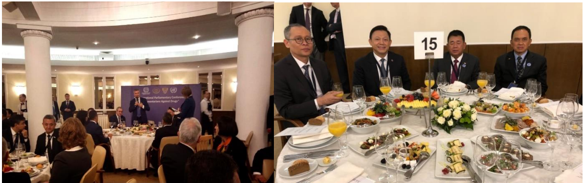
คณะผู้แทนสภานิติบัญญัติแห่งชาติร่วมงานเลี้ยงรับรอง ณ อาคารสภาผู้แทนราษฎร โดยมีนาย Vyacheslav Volodin ประธานสภาผู้แทนราษฎรสหพันธรัฐรัสเซียเป็นเจ้าภาพ

๒. การร่วมงานเลี้ยงรับรอง เมื่อวันจันทร์ที่ ๔ ธันวาคม ๒๕๖๐ สำหรับผู้เข้าร่วมการประชุม รัฐสภาระหว่างประเทศว่าด้วยการต่อต้านยาเสพติด โดยนาย Vyacheslav Volodin ประธานสภาผู้แทนราษฎร สหพันธรัฐรัสเซียเป็นเจ้าภาพ