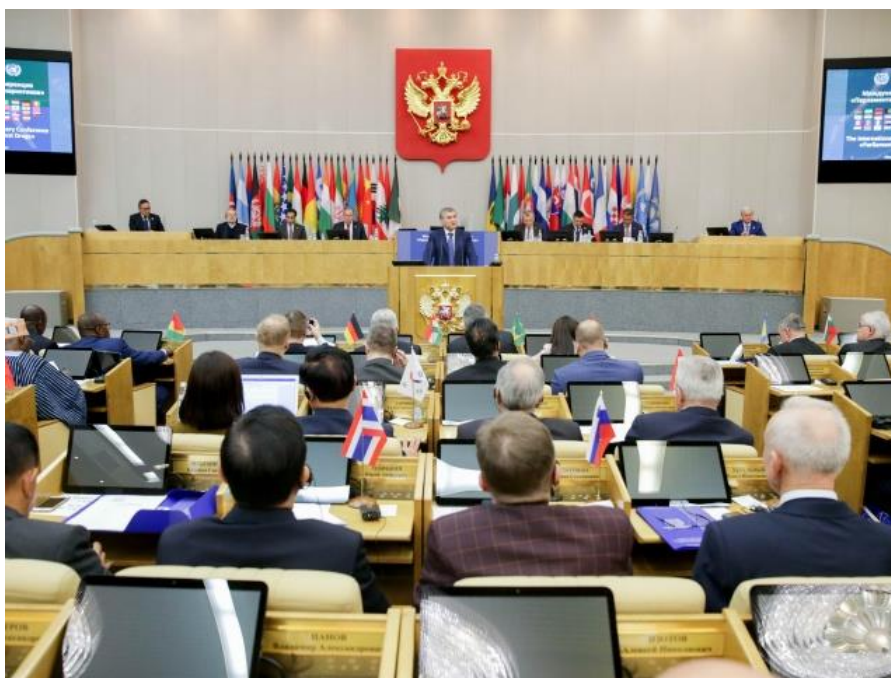
นาย Vyacheslav Volodin ประธานสภาผู้แทนราษฎรสหพันธรัฐรัสเซีย กล่าวต้อนรับผู้เข้าร่วมการประชุมรัฐสภาระหว่างประเทศว่าด้วยการต่อต้านยาเสพติด ณ อาคารสภาผู้แทนราษฎร สหพันธรัฐรัสเซีย