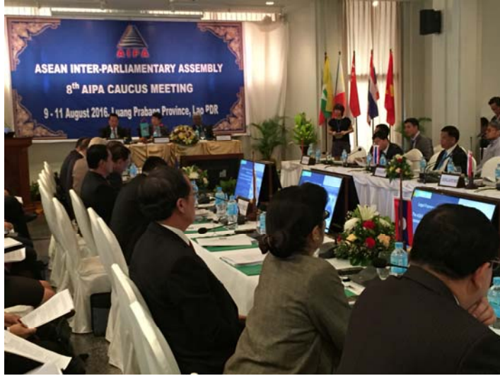
ภาพบรรยากาศห้องประชุม การประชุมเต็มคณะ ช่วงที่ ๑ และ ๒