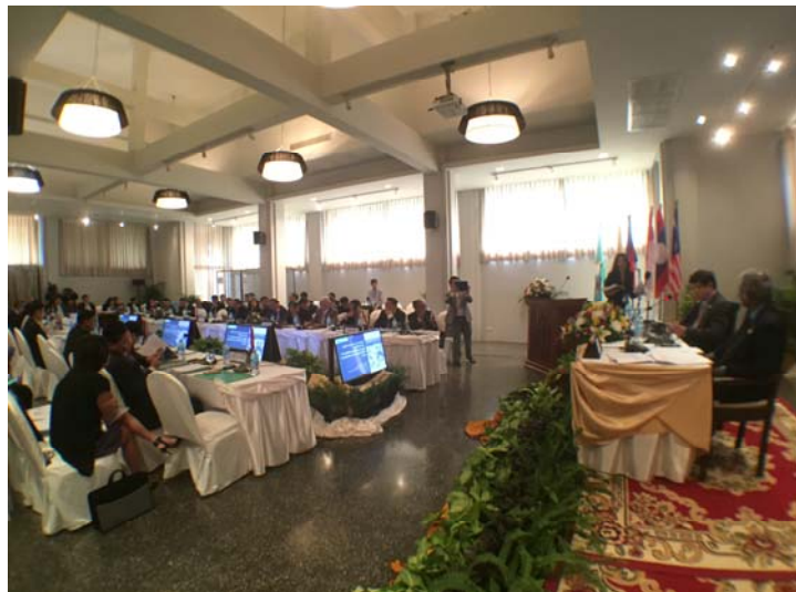
ภาพบรรยากาศห้องประชุม การประชุม AIPA Caucus ครั้งที่ ๘