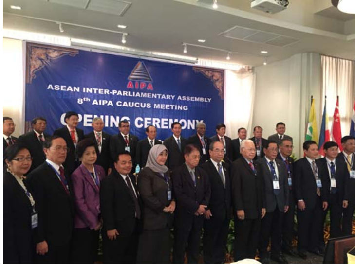
คณะผู้แทนรัฐสภาสมาชิก AIPA ถ่ายภาพเป็นที่ระลึกในพิธีเปิดการประชุม AIPA Caucus ครั้งที่ ๘