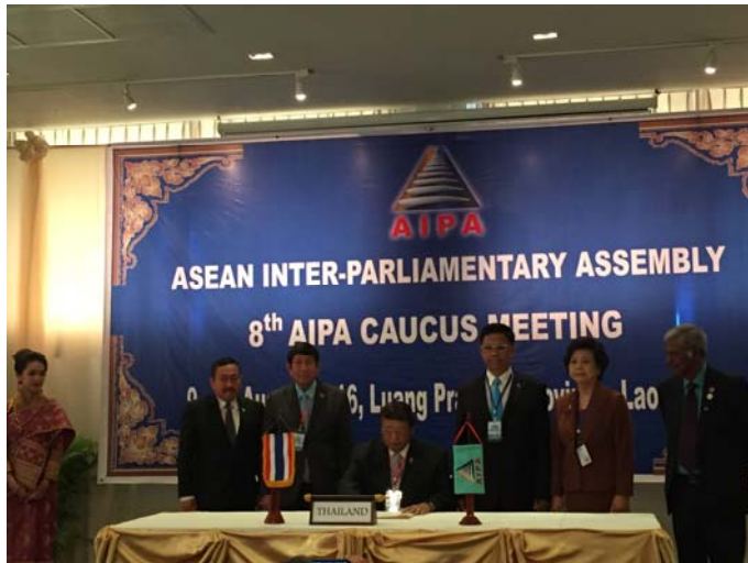
พลอากาศเอก ชาลี จันทร์เรือง สมาชิกสภานิติบัญญัติแห่งชาติ หัวหน้าคณะผู้แทนสภานิติบัญญัติแห่งชาติ ลงนามในรายงานการประชุม AIPA Caucus ครั้งที่ ๘