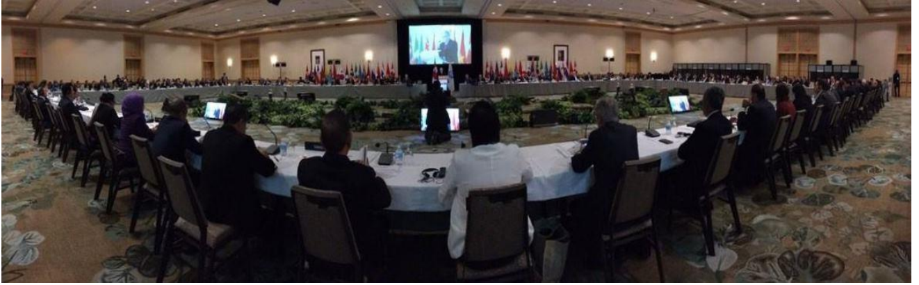
บรรยากาศภายในห้องประชุมเต็มคณะฯ