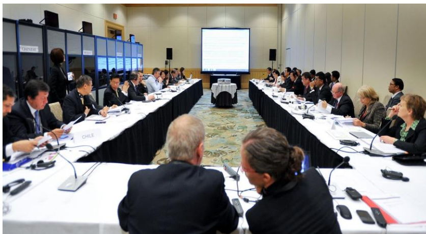
บรรยากาศห้องประชุมคณะกรรมการร่างฯ

๔. การประชุมคณะกรรมการร่างข้อมติและแถลงการณ์ร่วม (Meeting of the Drafting Committee) มีขึ้นระหว่างวันจันทร์ที่ ๑๘ ถึงวันพุธที่ ๒๐ มกราคม ๒๕๕๙ เพื่อทำหน้าที่พิจารณาร่างข้อมติ (Draft Resolutions) ที่เสนอโดยประเทศสมาชิก รวมทั้งพิจารณาและยกร่างแถลงการณ์ร่วม (Joint Communiqué) ซึ่งเป็นเอกสารสุดท้ายของการประชุมที่ได้สรุปวาระสำคัญจากการประชุม โดยมีข้อมติในประเด็นต่าง ๆ ที่ผ่านการเห็นชอบจากที่ประชุมฯ จำนวน ๒๗ ข้อมติ (จากจำนวน ๔๗ ร่างข้อมติที่ประเทศต่าง ๆ เสนอ) เพื่อเสนอให้ที่ประชุมเต็มคณะรับรอง