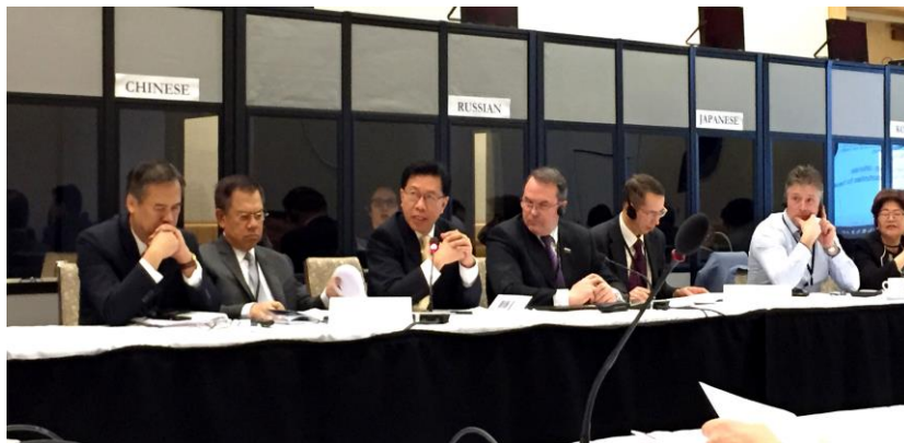
คณะผู้แทนไทยฯ เข้าร่วมในการประชุมคณะกรรมการยกร่างฯ

๓.๓ ร่างข้อมติที่ APPF24/17 เสนอโดยรัสเซีย นิวซีแลนด์ แคนาดา ญี่ปุ่น เม็กซิโก และประเทศไทย เรื่อง “เศรษฐกิจ การค้า และห่วงโซ่แห่งคุณค่าในระดับภูมิภาค” โดยสาระสำคัญส่วนที่ไทยผลักดันเกี่ยวกับการสนับสนุนและเสริมสร้างความพยายามในการทำงานด้านนิติบัญญัติ เพื่อให้เกิดความก้าวหน้าในกฎหมายที่เกี่ยวข้องกับ SMEs และนำไปสู่การให้สัตยาบันหรือสนับสนุนข้อตกลงระหว่างประเทศที่เกี่ยวข้องกับ SMEs และการสนับสนุนปฏิญญาผู้นำเอเปค ปี ๒๕๕๘ ในการเสริมสร้างศักยภาพของผู้ประกอบการ SMEs เพื่อสนับสนุนการเติบโตทางเศรษฐกิจและการขยายตัวทางการค้าและการลงทุน ด้วยการใช้อินเทอร์เน็ตและเศรษฐกิจดิจิทัล