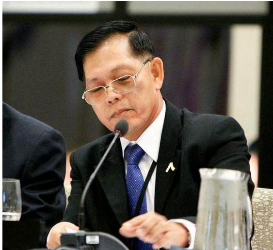
พลอากาศเอก ทรงธรรม โชคคณาพิทักษ์ กล่าวถ้อยแถลงในประเด็นการต่อต้านการก่อการร้าย

๒.๒ การประชุมเต็มคณะวาระที่ ๑ ด้านการเมืองและความมั่นคง ในหัวข้อ “การต่อต้านการก่อการร้าย” โดย พลอากาศเอก ทรงธรรม โชคคณาพิทักษ์ สมาชิกสภานิติบัญญัติแห่งชาติ กล่าวถึง การแก้ปัญหาการต่อต้านการก่อการร้ายอย่างยั่งยืนโดยขจัดเหตุรากเหง้าของปัญหา ได้แก่ ความยากจน ความอยุติธรรม ความเหลื่อมล้ำทางเศรษฐกิจและสังคม และการขาดการศึกษา รวมทั้งสนับสนุนสิทธิ เสรีภาพและอิสรภาพของประชาชนให้เท่าเทียมกัน และเคารพความแตกต่างทางศาสนาและวัฒนธรรม และเสนอให้รัฐสภาร่วมกับภาครัฐบาลควรสนับสนุนให้ใช้สื่อสังคมเป็นช่องทางการติดต่อ สื่อสารเชิงบวก เพื่อสนับสนุนความสำคัญ ของการป้องกันการก่อการร้าย ค่านิยมของการเจรจาอย่างสันติ และสนับสนุนให้มีหน่วยงานกลางหรือบริการสายด่วนแจ้งเหตุผิดปกติ