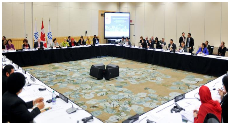
บรรยากาศห้องประชุมสมาชิกรัฐสภาสตรี

๑. การประชุมสมาชิกรัฐสภาสตรี (Meeting of Women Parliamentarians) จัดขึ้นเป็นครั้งแรก โดยมีขึ้นในวันอาทิตย์ที่ ๑๗ มกราคม ๒๕๕๙ มีสมาชิกรัฐสภาสตรีจากแคนาดาและอินโดนีเซียเป็นประธานการประชุม ประกอบด้วยวาระการอภิปรายทั่วไปในหัวข้อ “สตรีในการเมืองและรัฐสภา” และวาระการอภิปรายทั่วไปเพื่อเสนอแนะเกี่ยวกับการประชุมสมาชิกรัฐสภาสตรี APPF ในอนาคต รวมทั้งพิจารณาร่างข้อมติด้านสตรีที่จัดเตรียมโดยประธานร่วมของการประชุม