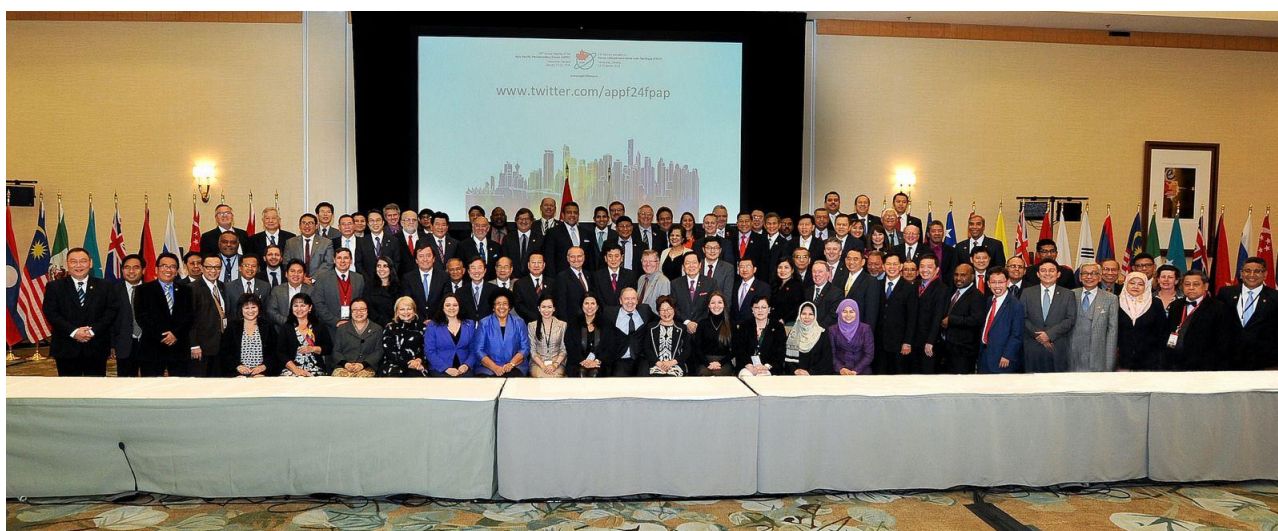
สมาชิกรัฐสภาจากประเทศสมาชิกและประเทศผู้สังเกตการณ์ในการประชุม APPF ครั้งที่ ๒๔

การประชุมประจำปีรัฐสภาภาคพื้นเอเชียและแปซิฟิก ครั้งที่ ๒๔ (The 24 th Annual Meeting of the Asia – Pacific Parliamentary Forum – APPF) ภายใต้หัวข้อ “ความเป็นหุ้นส่วนที่เข้มแข็ง เพื่อความรุ่งเรือง ความมั่นคง และการเจริญเติบโต (Strengthened Partnerships for Prosperity, Security and Growth) จัดขึ้นระหว่างวันที่ ๑๗ - ๒๑ มกราคม ๒๕๕๙ ณ นครแวนคูเวอร์ ประเทศแคนาดา มีผู้เข้าร่วมการประชุมจำนวน ๒๕๒ คน โดยมีรัฐสภาจากประเทศสมาชิกเข้าร่วมการประชุมจำนวน ๒๐ ประเทศ และประเทศผู้สังเกตการณ์จำนวน ๑ ประเทศ ได้แก่ บรูไนดารุสซาลาม