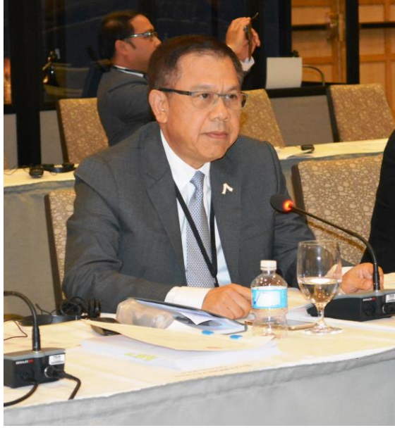
พลเรือเอก ชุมชุม อัจฉริยะ กล่าวถ้อยแถลงในประเด็นปัญหาอาชญากรรมข้ามชาติและการค้ามนุษย์

๒.๒ การประชุมเต็มคณะวาระที่ ๑ ด้านการเมืองและความมั่นคง ในหัวข้อ “การต่อต้านการก่อการร้าย” โดย พลอากาศเอก ทรงธรรม โชคคณาพิทักษ์ สมาชิกสภานิติบัญญัติแห่งชาติ กล่าวถึง การแก้ปัญหาการต่อต้านการก่อการร้ายอย่างยั่งยืนโดยขจัดเหตุรากเหง้าของปัญหา ได้แก่ ความยากจน ความอยุติธรรม ความเหลื่อมล้ำทางเศรษฐกิจและสังคม และการขาดการศึกษา รวมทั้งสนับสนุนสิทธิ เสรีภาพและอิสรภาพของประชาชนให้เท่าเทียมกัน และเคารพความแตกต่างทางศาสนาและวัฒนธรรม และเสนอให้รัฐสภาร่วมกับภาครัฐบาลควรสนับสนุนให้ใช้สื่อสังคมเป็นช่องทางการติดต่อ สื่อสารเชิงบวก เพื่อสนับสนุนความสำคัญ ของการป้องกันการก่อการร้าย ค่านิยมของการเจรจาอย่างสันติ และสนับสนุนให้มีหน่วยงานกลางหรือบริการสายด่วนแจ้งเหตุผิดปกติ