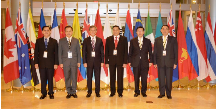
คณะผู้แทนสถานนิติบัญญัติแห่งชาติในการประชุมประจำปีรัฐสภาภาคพื้นเอเชียและแปซิฟิก ครั้งที่ ๒๔