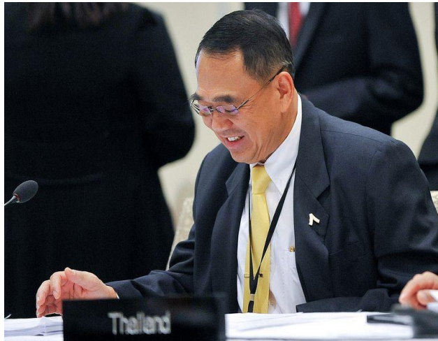
พลอากาศเอก ชนิต รัตนอุบล กล่าวถ้อยแถลงในประเด็นด้านสตรี

๑. การประชุมสมาชิกรัฐสภาสตรี โดย พลอากาศเอก ชนิต รัตนอุบล สมาชิกสภานิติบัญญัติแห่งชาติ ได้กล่าวถ้อยแถลงในหัวข้อ “สตรีในการเมืองและรัฐสภา” (Women in Politics and Parliaments) กล่าวถึง การตระหนักถึงความสำคัญของสตรีและความร่วมมือของบุรุษในการสนับสนุนบทบาทของสตรี และเชิญชวนให้มีความสำคัญกับการลดอคติและการเลือกปฏิบัติต่อสตรี ส่งเสริมบทบาทสตรีในทางการเมืองและการบริหารประเทศ การจัดการศึกษาขั้นพื้นฐานให้เด็กหญิงและสตรี และเปิดโอกาสการมีส่วนร่วมในทุกกระดับ