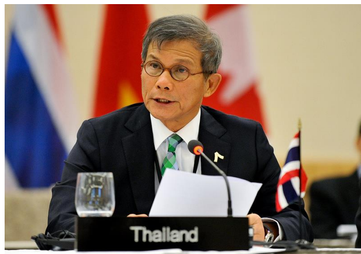
พลเอก ไพโรจน์ พานิชสมัย กล่าวถ้อยแถลงในประเด็นการคุ้มครองสัตว์ป่าและการจัดการระบบนิเวศฯ

๒.๕ การประชุมเต็มคณะ วาระที่ ๓ ด้านความร่วมมือในภูมิภาคเอเชียและแปซิฟิก ในหัวข้อ “การคุ้มครองสัตว์ป่าและการส่งเสริมการจัดการระบบนิเวศทางบกและทางทะเลที่ยั่งยืน” โดยพลเอก ไพโรจน์ พานิชสมัย สมาชิกสภานิติบัญญัติแห่งชาติ เป็นผู้กล่าวถ้อยแถลง โดยได้เสนอให้สนับสนุนมาตรการต่าง ๆ เช่น การดำเนินการเชิงรุกในการบริหารจัดการด้านสิ่งแวดล้อมทางบกและทางทะเลอย่างยั่งยืน การส่งเสริมความร่วมมือระหว่างหน่วยงานภาครัฐและภาคส่วนต่าง ๆ ตั้งแต่ระดับท้องถิ่น ประเทศ ภูมิภาค และนานาชาติ รวมทั้งสนับสนุนบทบาทของสถาบันนิติบัญญัติในการสนับสนุนงบประมาณสำหรับโครงการที่ส่งเสริมการรักษาสิ่งแวดล้อม