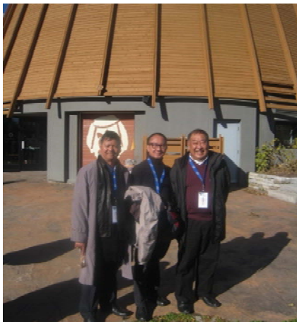
นายสมพล วณิชพันธุ์ รองเลขาธิการสภาผู้แทนราษฎร นายจเร พันธุ์เปรื่อง รองเลขาธิการสภาผู้แทนราษฎรและนายสมศักดิ์ มนูญปิฎ รองเลขาธิการวุฒิสภา ร่วมทัศนศึกษา ณ หมู่บ้านอินเดียนแดง (Traditional Huron Site Onhoüa Chetek&e)