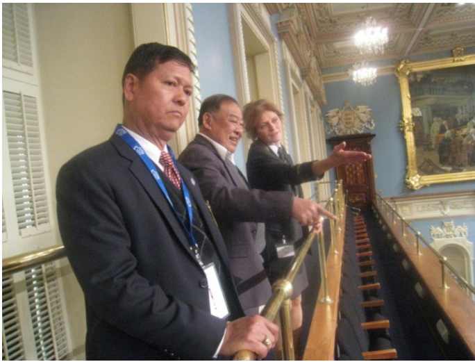
คณะผู้แทนไทยเข้าเยี่ยมชมสภาเมืองควิเบก