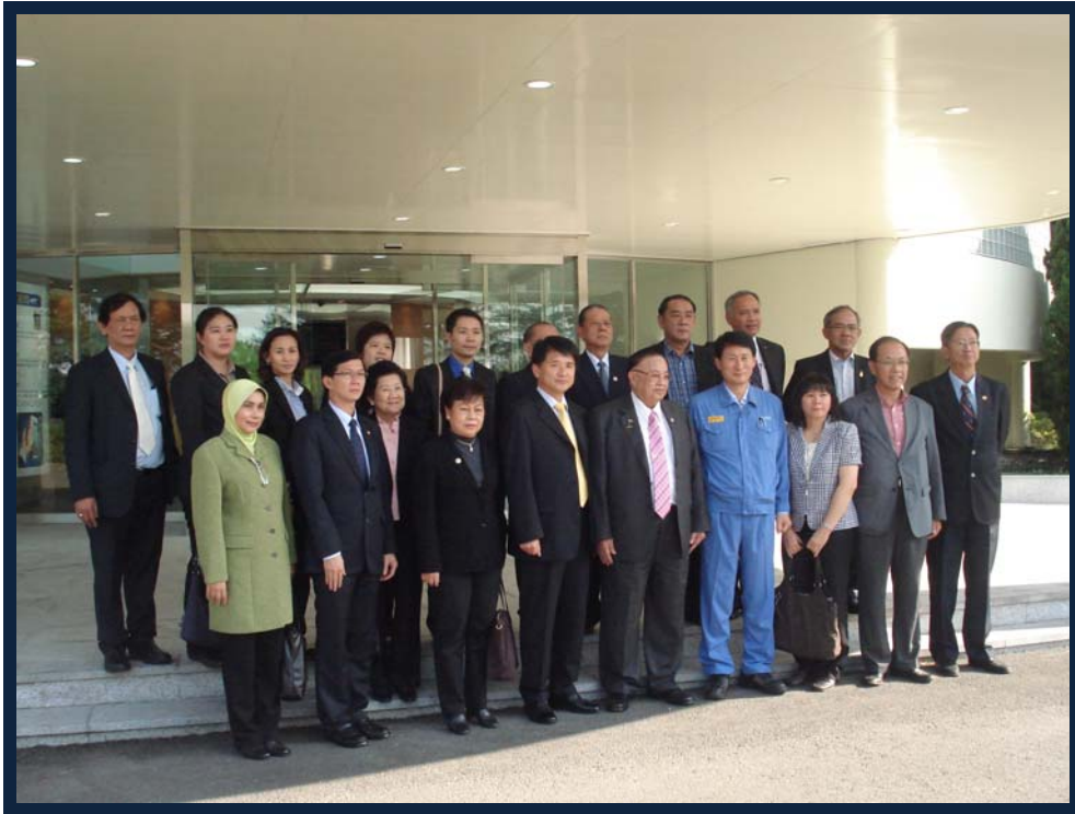
เยี่ยมชมบริษัทผลิตเหล็กกล้า POSCO ในวันอาทิตย์ที่ ๑๐ ตุลาคม ๒๕๕๓ เวลา ๑๔.๓๐ นาฬิกา ณ เมืองโพฮัง สาธารณรัฐเกาหลี