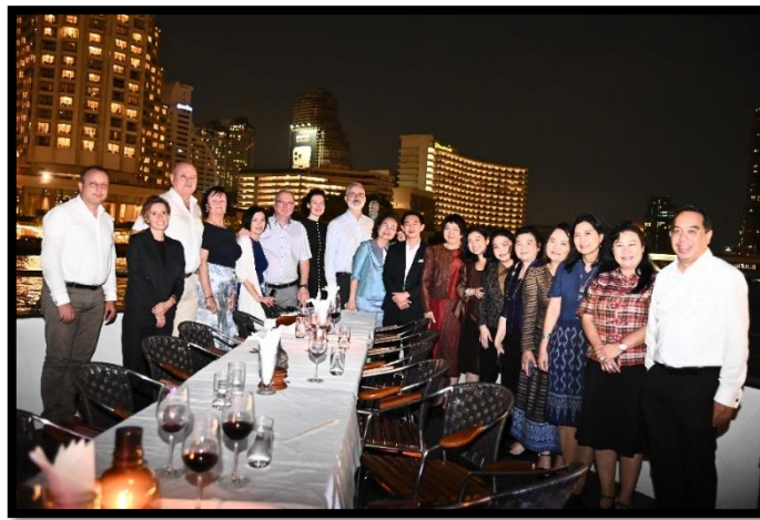
บรรยากาศงานเลี้ยงอาหารค่ำ

วันอังคารที่ ๗ กุมภาพันธ์ ๒๕๖๖ เวลา ๑๐.๐๐ - ๑๑.๐๐ นาฬิกา เยี่ยมชมมิวเซียมสยาม