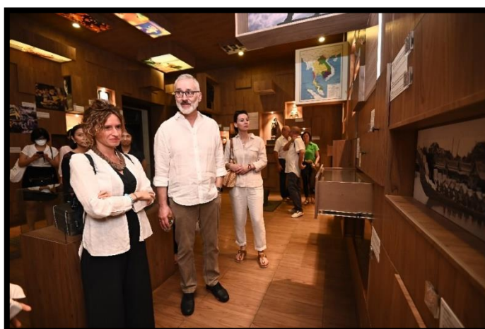
ดร. เอริก ซูซ เลขาธิการรัฐสภาฮังการี และคณะ เยี่ยมชมมิวเซียมสยาม