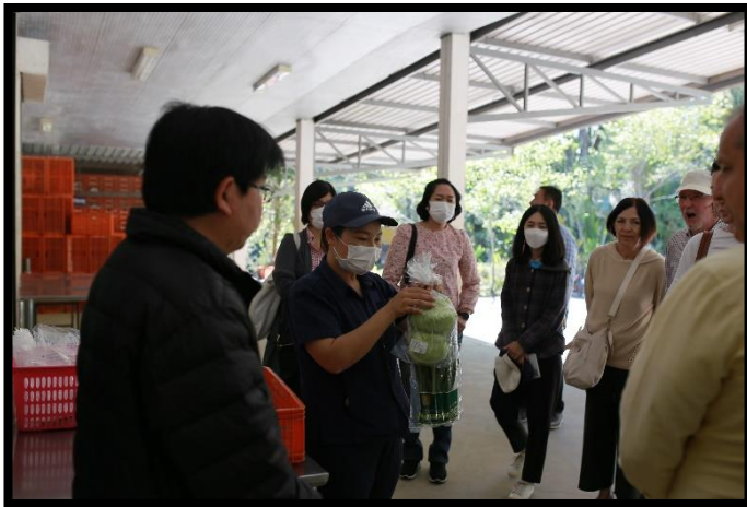
ดร. เวิร์ก ชูช เลขาธิการรัฐสภาอังกฤษ และคณะ เยี่ยมชมสถานีเกษตรหลวงดอยอินทนนท์ และ หน่วยวิจัยขุนห้วยแห้ง

คณะได้เข้าชมการสาธิตการปลูกและตัดต่อพันธุ์ดอกกุหลาบแบบโครงการหลวง การบรรจุและ ห่อบรรจุดอกกุหลาบสำหรับการขนส่ง เพื่อรักษาสภาพกลีบดอกและคงความสดระหว่างการขนส่งไปยัง ตลาดในจังหวัดต่าง ๆ การจัดการพืชผลทางการเกษตรหลังการเก็บเกี่ยว เรื่องการคัดบรรจุและ คัดมาตรฐาน นอกจากนี้ เลขาธิการรัฐสภาอังกฤษ ยังได้ทดลองการเตรียมต้นกล้าและการเสียบยอด มะเขือเทศ เพื่อส่งต่อให้เกษตรกรในพื้นที่นำไปเพาะปลูกต่อไป