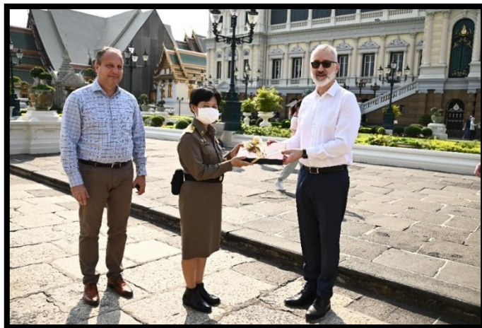
ดร. เวิร์ก ชูช เลขาธิการรัฐสภาอังกฤษ รับมอบหนังสือที่ระลึกจากเจ้าหน้าที่งานในพระองค์