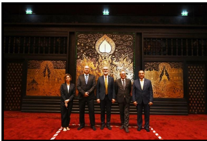
ดร. เยิร์ก ชูช เลขาธิการรัฐสภาฮังการี และคณะ เยี่ยมชมเครื่องยอดอาคารรัฐสภา

วันจันทร์ที่ ๖ กุมภาพันธ์ ๒๕๖๖ เวลา ๑๘.๓๐ - ๒๑.๓๐ นาฬิกา งานเลี้ยงรับรองอาหารค่ำ บนเรือล่องแม่น้ำเจ้าพระยา