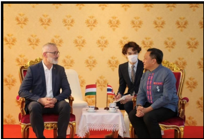
/(รูป) ดร. เอิร์ก ชูช...

ในการนี้ ผู้ว่าราชการจังหวัดเชียงใหม่ ได้มอบช่างแกะสลักจากหินศิลาตลเป็นที่ระลึกให้แก่ เลขาธิการรัฐสภาฮังการี และรับมอบงานประดับรูปรัฐสภาฮังการี