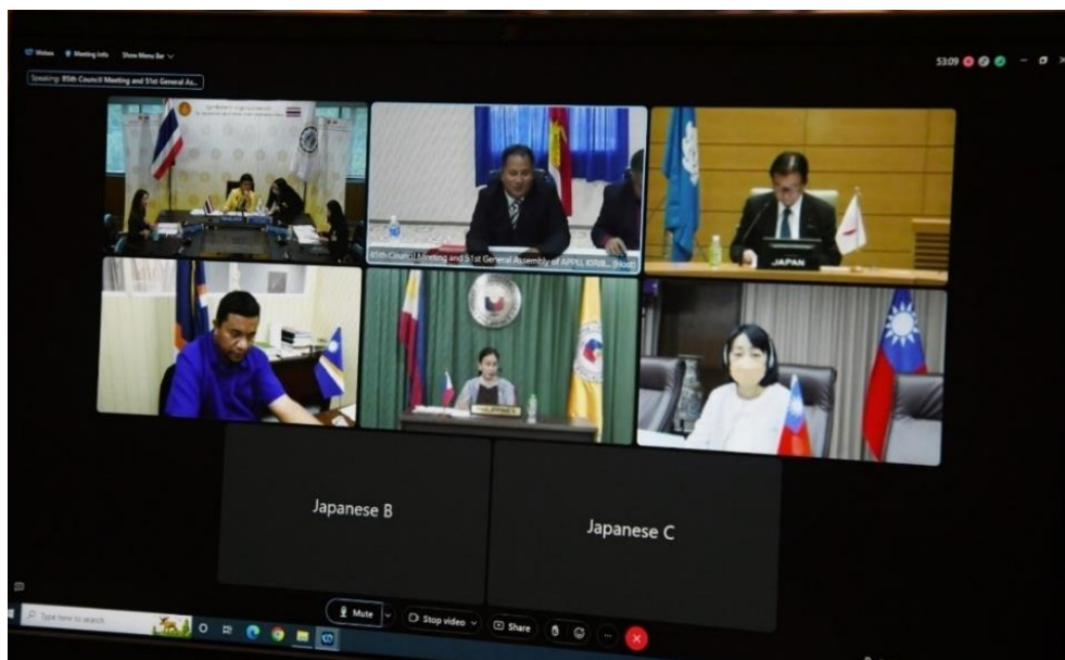
การนำเสนอรายงานสถานการณ์ประเทศ (Country Report) ของผู้แทนจากหน่วยประจำชาติ

หัวหน้าคณะผู้แทนหน่วยประจำชาติสมาชิก APPU ที่เข้าร่วมการประชุมได้นำเสนอรายงานสถานการณ์ประเทศ โดยเรียงลำดับดังนี้ ๑) สาธารณรัฐจีน (ไต้หวัน) ๒) ญี่ปุ่น ๓) สาธารณรัฐหมู่เกาะมาร์แชลล์ ๔) สาธารณรัฐฟิลิปปินส์ ๕) ราชอาณาจักรไทย และ ๖) สาธารณรัฐคีริบาส