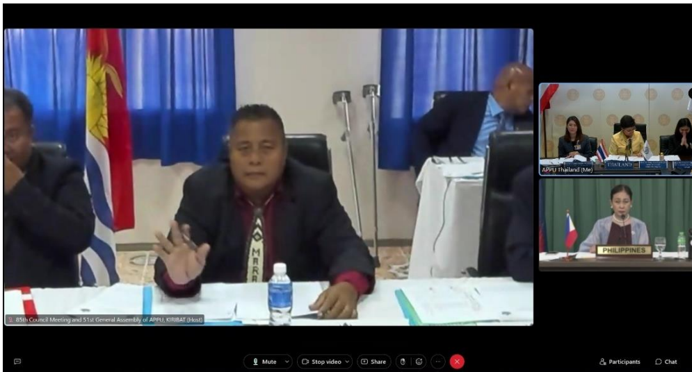
นายเทรียทะ มะเว็มเว็นนิกียกิ ประธานการประชุมคณะมนตรีฯ ครั้งที่ ๘๕ กล่าวเปิดการประชุม

นายเทรียทะ มะเว็มเว็นนิกียกิ สมาชิกรัฐสภาคิริบาส ประธานการประชุมคณะมนตรีฯ ได้เปิดการประชุมโดยกล่าวขอบคุณประเทศสมาชิกสหภาพฯ ที่ให้ความสนใจและเข้าร่วมการประชุมผ่านสื่ออิเล็กทรอนิกส์ที่คิริบาสได้จัดขึ้น และกล่าวถึงสถานการณ์ของการแพร่ระบาดของโรคโควิด 19 ที่ผ่อนคลายลงไปบ้างแล้ว แต่อย่างไรก็ดี ความร่วมมือกันในประชาคมระหว่างประเทศยังคงเป็นเรื่องที่จำเป็น และได้นัยย้ำถึงความสำคัญของการรวมกลุ่มของประเทศในภูมิภาคเอเชียและแปซิฟิกเพื่อร่วมมือกันสร้างสรรค์สังคมที่สามารถฟื้นตัวหลังโรคโควิด 19 ได้อย่างยั่งยืน ควบคู่ไปกับเสถียรภาพและความมั่นคงสันติภาพ และความเจริญรุ่งเรืองของประเทศสมาชิกภายในภูมิภาค สาธารณรัฐคิริบาสมีความยินดีที่จะได้เป็นส่วนหนึ่งในการส่งเสริมความร่วมมือดังกล่าวผ่านบทบาทเจ้าภาพการประชุมในครั้งนี้