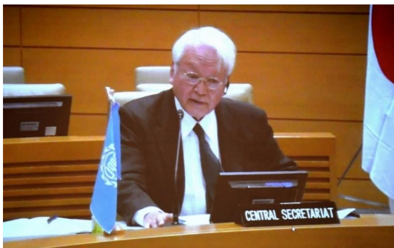
นายเออิจิ ชูซุกิ เลขาธิการสหภาพสมาชิกรัฐสภาเอเชียและแปซิฟิก กล่าวรายงานการดำเนินการและรายงานการเงินของสหภาพฯ ต่อที่ประชุม

(ประมาณ ๖๐๐,๙๒๒.๕๐ บาท) ในส่วนของประมาณการงบประมาณปี ๒๕๖๕ (ตั้งแต่วันที่ ๑ เมษายน ๒๕๖๕ ถึงวันที่ ๓๑ มีนาคม ๒๕๖๖) คาดว่าจะมีรายจ่าย ๔,๓๓๕,๐๐๐ เยน (ประมาณ ๑,๑๒๗,๑๐๐ บาท) และมียอดยกไปปีงบประมาณถัดไป ๙๔๗,๑๗๑ เยน (ประมาณ ๒๔๖,๒๖๔ บาท) (อ้างอิงอัตราแลกเปลี่ยนเงินตราต่างประเทศของธนาคารแห่งประเทศไทย ณ วันที่ ๑๒ ตุลาคม ๒๕๖๕ โดย ๑ เยน มีมูลค่าประมาณ ๐.๒๖ บาท)