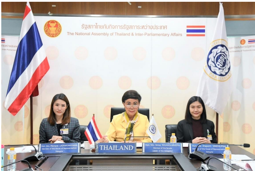
คณะผู้แทนรัฐสภาไทยในการประชุมคณะมนตรีสหภาพสมาชิกรัฐสภาเอเชียและแปซิฟิก ครั้งที่ ๘๕ และการประชุมสมัชชาใหญ่สหภาพสมาชิกรัฐสภาเอเชียและแปซิฟิก ครั้งที่ ๕๑