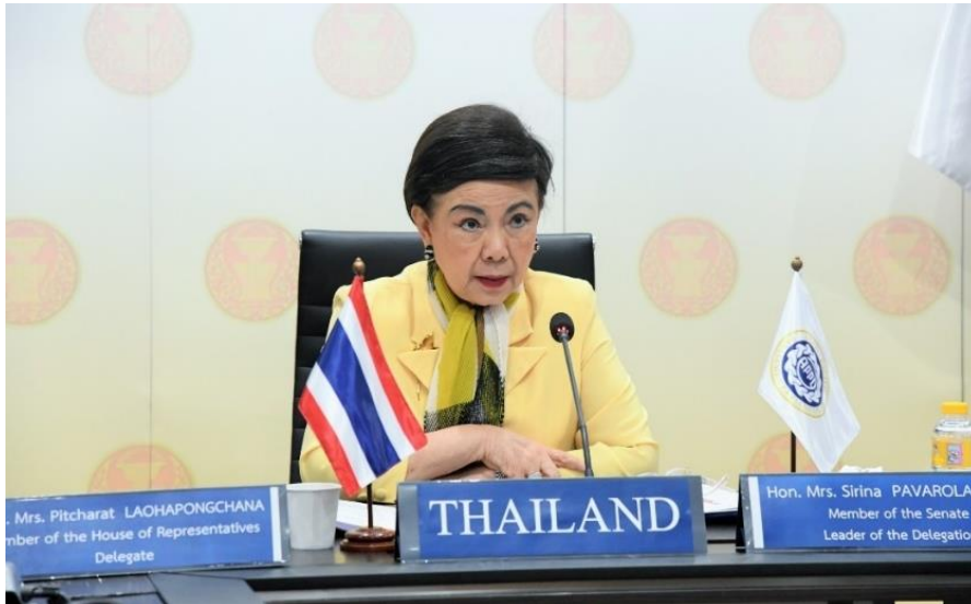
นางศิรินา ปวโรฬารวิทยา สมาชิกวุฒิสภา หัวหน้าคณะผู้แทนรัฐสภาไทย กล่าวรายงานสถานการณ์ประเทศไทย ในการประชุมสมัชชาใหญ่สหภาพสมาชิกรัฐสภาเอเชียและแปซิฟิก ครั้งที่ ๕๑

สามารถมุ่งสู่การบรรลุเป้าหมายความเป็นกลางทางคาร์บอน ภายในปี ค.ศ. ๒๐๕๐ และเป้าหมายการปล่อยก๊าซเรือนกระจกสุทธิเป็นศูนย์ได้ ภายในปี ค.ศ. ๒๐๖๕