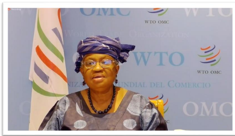
ผู้อำนวยการใหญ่องค์การการค้าโลก กล่าวคำกล่าวต้อนรับผู้เข้าร่วมประชุม

ในโลกของการค้าระหว่างประเทศไม่มีวิธีการใดที่จะเหมาะสมกับทุกเรื่อง การจัดการให้ประเทศต่าง ๆ เข้าร่วมในข้อตกลงด้านการค้าเป็นเรื่องซับซ้อน ตั้งแต่การสนับสนุนนโยบายการค้าจนกระทั่งการนำข้อตกลงไปปฏิบัติให้ราบรื่น โดยสมาชิกรัฐสภาเป็นส่วนสำคัญในกระบวนการเหล่านี้ การประชุมนี้จะเป็นเวทีสำหรับสมาชิกรัฐสภานักกฎหมาย และเจ้าหน้าที่ด้านการค้าในการแบ่งปันประสบการณ์และแลกเปลี่ยนองค์ความรู้ด้านการค้าระหว่างประเทศ และสร้างความเข้าใจอย่างลึกซึ้งต่อระบบการค้าระหว่างประเทศ การปฏิบัติ การเจรจาและข้อตกลง รวมทั้งการกำหนดนโยบายที่เกี่ยวข้องกับการค้าและข้อตกลงและการนำนโยบายไปปฏิบัติ ทั้งนี้ บริษัทเทมาเส็กและมูลนิธิเทมาเส็กได้สนับสนุนโครงการที่สร้างศักยภาพในด้านสุขภาพ การศึกษา การบริหารจัดการเมือง บริหารรัฐกิจ และความพร้อมด้านภัยพิบัติด้วยมูลค่ากว่า ๒๓๕ ดอลลาร์สิงคโปร์ จากกว่า ๕๐๐ โครงการ และเชื่อว่าการประชุมเชิงปฏิบัติการนี้จะเสริมสร้างเครือข่ายระหว่างบุคคลและสนับสนุนการบูรณาการทางเศรษฐกิจและการเจริญเติบโตของภูมิภาคเอเชียและภูมิภาคอื่น ๆ ได้ สุดท้ายขอให้ทุกคนปลอดภัยดังคำกล่าวที่ว่า “ไม่มีใครปลอดภัยจนกระทั่งทุกคนปลอดภัย” (No one is safe until everyone is safe.)