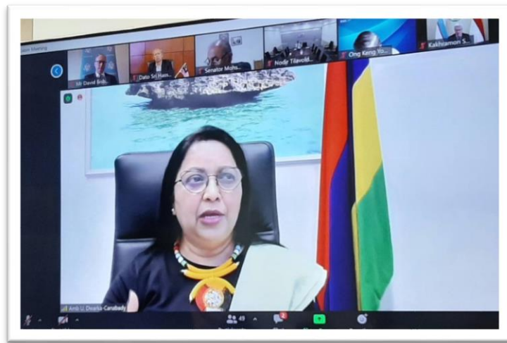
ผู้แทนถาวรมอริเชียสประจำองค์การการค้าโลก ระหว่างการประชุมเชิงปฏิบัติการวันที่สาม