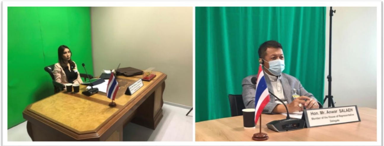
คณะผู้แทนไทยระหว่างการเข้าร่วมประชุมเชิงปฏิบัติการ