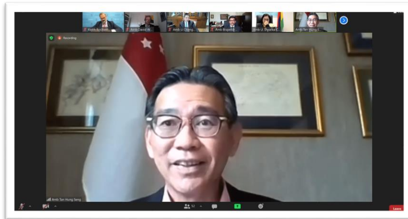
เอกอัครราชทูต Tan Hung Seng บรรยายระหว่างการประชุมเชิงปฏิบัติการ

ท่ามกลางสถานการณ์แพร่ระบาดของโควิด-๑๙ เศรษฐกิจของแอฟริกาได้รับผลกระทบมากที่สุดและเป็น มูลเหตุที่จะทำให้แอฟริกาพลาดการมีส่วนร่วมในทศวรรษแห่งการพัฒนา (Decade of Growth) เหตุผลสำคัญ เพราะเศรษฐกิจของแอฟริกาพึ่งพาสินค้าโภคภัณฑ์เพียง ๒ รายการ ซึ่งสะท้อนให้เห็นข้อเท็จจริงว่าเศรษฐกิจที่พึ่งพา อยู่กับสินค้าเพียงแค่ ๒-๓ รายการ ก็จะไม่สามารถพัฒนาประเทศไปในทิศทางที่เราต้องการได้ ด้วยเหตุเพราะ เศรษฐกิจไม่หลากหลายมากเพียงพอ