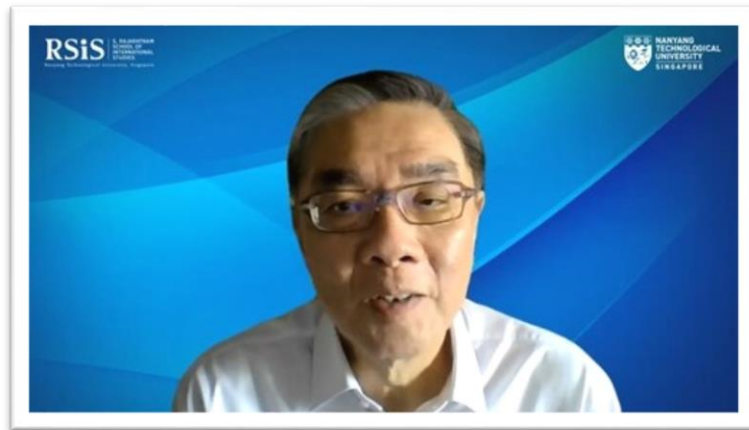
เอกอัครราชทูต Ong Keng Yong ขณะกล่าวคำกล่าวต้อนรับผู้เข้าร่วมการประชุม

จัดทำความตกลงเพื่อกำหนดกฎระเบียบในการทำประมงเพื่อรักษาทรัพยากรทางทะเล ประเด็นด้านสภาพภูมิอากาศที่จะฟื้นฟูสิ่งแวดล้อมของภาคสินค้าและบริการ และการเจรจาภายใต้กรอบพหุภาคีอิเล็กทรอนิกส์ที่มีการบรรลุข้อตกลงในลายเซ็นอิเล็กทรอนิกส์ (electronic signature) และการรับรอง (authentication) ไปแล้ว ซึ่งประเด็นเหล่านี้จะถูกพิจารณาต่อในการประชุม MC 12 ในปี ๒๕๖๔ โดยสมาชิก WTO จะต้องแสดงให้เห็นถึงการดำเนินการอย่างมีประสิทธิภาพภายใต้วิกฤติการณ์นี้ ซึ่งผลลัพธ์จากการประชุม MC 12 และการดำเนินการของ WTO หลังจากนั้นจะมีความสำคัญต่อ WTO ในการกลับมาสู่วัตถุประสงค์ขององค์การ