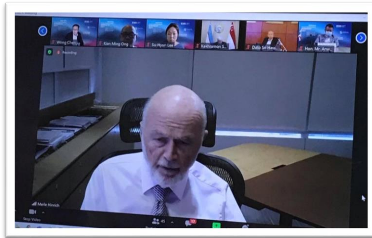
นาย Merle A. Hinrich บรรยายต่อที่ประชุมผ่านสื่ออิเล็กทรอนิกส์

ดำเนินการ การตรวจสอบต่าง ๆ เป็นต้น ที่ผ่านมามีการร่วมมือกับรัฐบาลในการหาข้อดีที่จะแก้ไขและสนับสนุนให้ธุรกิจดำเนินต่อไปได้ และสนับสนุนด้านสุขภาพให้ทุกคนปลอดภัยและมีสุขภาพดี โดยรัฐบาลได้เห็นความสำคัญของห่วงโซ่อุปทานที่ต้องดำเนินต่อไป เนื่องจากประชาชนยังคงสั่งซื้อสินค้าและอาหาร จึงได้อนุญาตให้ดำเนินการด้านพิธีการศุลกากร และติดต่อกับลูกค้าได้ ส่วนเงินใช้การบริหารจัดการระบบแบบปิด หรือสิ่งคิโพรเรียกว่า bubble wrap เพื่อให้ห่วงโซ่อุปทานและแรงงานดำเนินต่อไปได้ ทั้งนี้ การติดต่อกันทางกายภาพและการเดินทางลดน้อยลงความสามารถในการขนส่งสินค้าทางอากาศของโลกลดลงร้อยละ ๙ อัตราค่าขนส่งสูงขึ้นมากจากก่อนสถานการณ์โควิด-๑๙ ธุรกิจขนาดเล็กได้รับผลกระทบซึ่งส่งผลให้เกิดช่องว่างทางเศรษฐกิจมากขึ้น การฟื้นฟูเศรษฐกิจให้เดินหน้าต่อไปในสถานการณ์ฉุกเฉินนี้วัคซีนจึงเป็นสิ่งจำเป็น และรัฐบาลควรริบปิดช่องว่างทางเศรษฐกิจที่กำลังจะเพิ่มขึ้นโดยเร็ว รัฐบาลต้องชัดเจนในการปฏิบัติตามองค์การการค้าโลกเพื่อลดอุปสรรคในทางการค้า การขนส่ง และห่วงโซ่อุปทาน เนื่องจากแต่ละประเทศมีวิธีการปฏิบัติทางศุลกากรต่างกัน การค้าและการเดินทางไม่สามารถแยกกันได้ การขนส่งต้องมีแนวทางที่ชัดเจนให้ธุรกิจเหล่านี้ทำงานได้