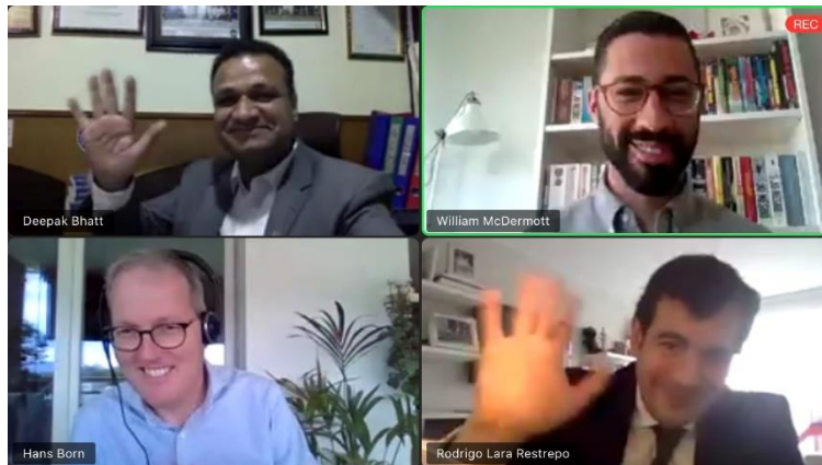
ผู้เข้าร่วมอภิปรายแสดงการทักทายเพื่ออำลาก่อน การสัมมนาออนไลน์เสร็จสิ้นลง เมื่อเวลาประมาณ ๒๑.๐๐ นาฬิกา ตามเวลาในประเทศไทย