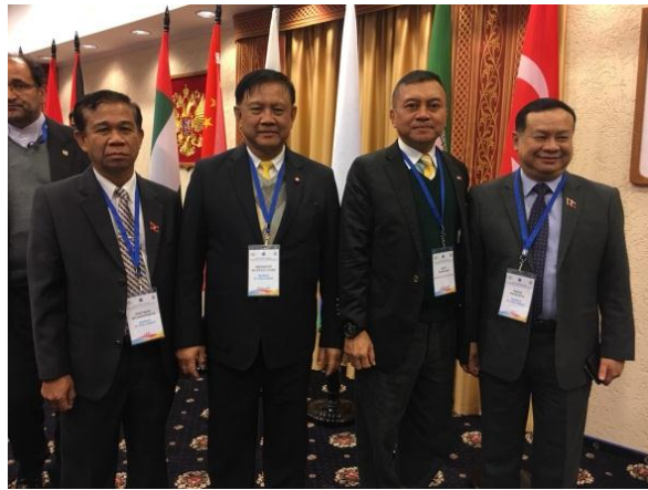
คณะผู้แทนสภานิติบัญญัติแห่งชาติถ่ายภาพร่วมกับคณะผู้แทนลาว ในโอกาสการประชุมคณะกรรมการว่าด้วยเศรษฐกิจและการพัฒนาที่ยั่งยืนของสมัชชารัฐสภาเอเชีย ณ ศูนย์วัฒนธรรมและธุรกิจ เมืองนาร์ยาน-มาร์ (Naryan-Mar) สหพันธรัฐรัสเซีย วันศุกร์ที่ ๑๙ เมษายน ๒๕๖๒