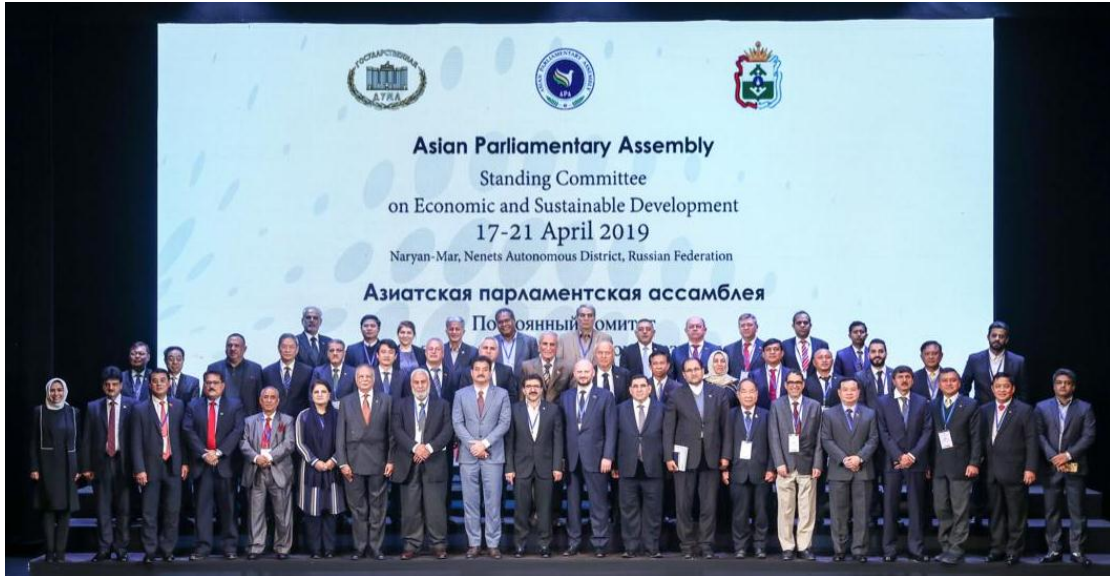
พลเอก นิพัทธ์ ทองเล็ก สมาชิกสภานิติบัญญัติแห่งชาติ และพลเรือเอก อมรเทพ ณ บางช้าง สมาชิกสภานิติบัญญัติแห่งชาติ ได้ถ่ายภาพหมู่ร่วมกับประธานการประชุมฯ และผู้เข้าร่วมการประชุมฯ ณ ศูนย์วัฒนธรรมและธุรกิจ เมืองนาร์ยาน-มาร์ (Naryan-Mar) สหพันธรัฐรัสเซีย วันศุกร์ที่ ๑๙ เมษายน ๒๕๖๒