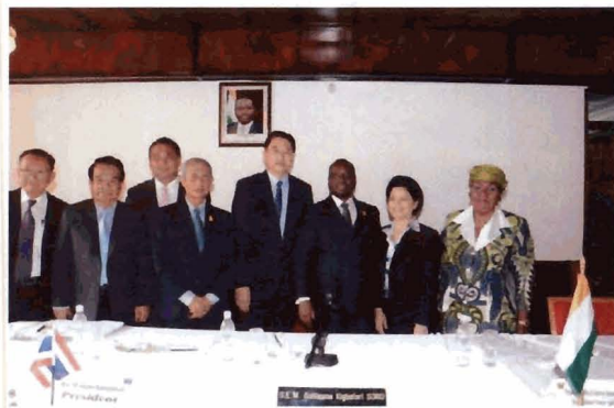
นายองอาจ คล้ามไพบูลย์ ประธานกลุ่มมิตรภาพสมาชิกรัฐสภาไทย - โกตดิวัวร์ และนายกิโยม กิกบาฟอริ โซโร ประธานสภาผู้แทนราษฎรโกตดิวัวร์