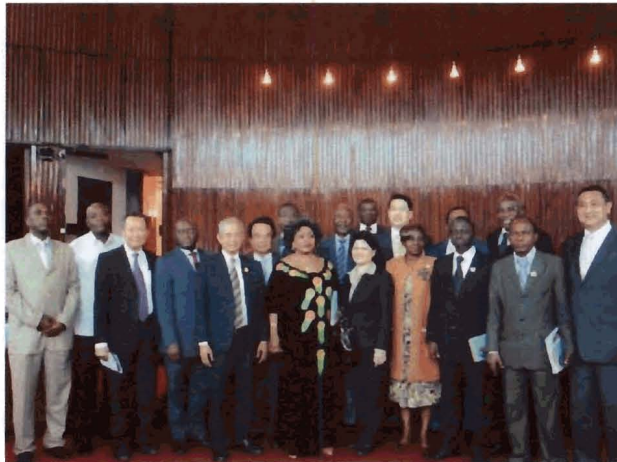
คณะฯ ถ่ายภาพร่วมกับประธานคณะกรรมการการต่างประเทศแห่งสาธารณรัฐโกตดิวัวร์ และสมาชิกรัฐสภาโกตดิวัวร์