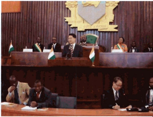
ประธานกลุ่มมิตรภาพสมาชิกรัฐสภาไทย-โกตดิวัวร์ ได้รับเกียรติในการขึ้นกล่าวสุนทรพจน์ ณ ห้องประชุมสภาแห่งสาธารณรัฐโกตดิวัวร์

นอกจากนี้ คณะฯ ได้เข้าเยี่ยมชมอาคารรัฐสภา และเข้าร่วมพิธีเปิดการประชุมสภาผู้แทนราษฎรสมัยสามัญ ครั้งที่ ๒ ประจำปีพ.ศ. ๒๕๕๖ ในวันที่ ๒ ตุลาคม ๒๕๕๖ เวลา ๑๖.๐๐ นาฬิกา ณ ห้องประชุมสภาแห่งสาธารณรัฐโกตดิวัวร์ (Hémicycle – Assemblée nationale de Côte d’Ivoire) ในโอกาสนี้ประธานกลุ่มมิตรภาพฯ ไทย-โกตดิวัวร์ ได้กล่าวสุนทรพจน์ ซึ่งสรุปใจความสำคัญได้ว่า การเดินทางมาเยือนของคณะกลุ่มมิตรภาพฯ ไทย-โกตดิวัวร์ในครั้งนี้เป็นประโยชน์อย่างยิ่งที่มีโอกาสพบปะสนทนาในเรื่องเศรษฐกิจ ซึ่งมีความสำคัญต่อประเทศโกตดิวัวร์ โดยเฉพาะเรื่องข้าว คณะฯ จะนำข้อคิดเห็นต่าง ๆ ไปดำเนินการให้เกิดประโยชน์ต่อทั้งประเทศไทยและประเทศโกตดิวัวร์ต่อไป นอกจากนี้ ประธานกลุ่มมิตรภาพฯ ไทย-โกตดิวัวร์ ได้ให้กำลังใจสมาชิกรัฐสภาโกตดิวัวร์ รวมทั้งประชาชนชาวโกตดิวัวร์ในการฟันฝ่าปัญหาและอุปสรรค สถานการณ์ความยากลำบากทั้งทางเศรษฐกิจ สังคม และการเมืองของโกตดิวัวร์ให้ได้