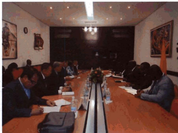
การเข้าพบปะสนทนากับนายกรัฐมนตรีแห่งสาธารณรัฐโกตดิวัวร์และสมาชิกรัฐสภาโกตดิวัวร์