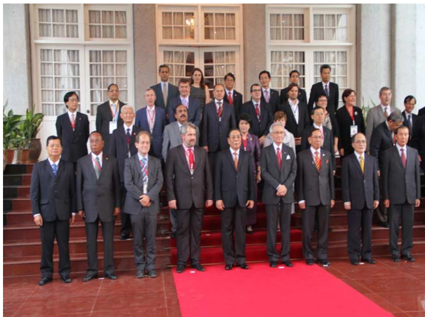
นายสุรชัย เลี้ยงบุญเลิศชัย รองประธานวุฒิสภา คนที่หนึ่ง หัวหน้าคณะผู้แทนรัฐสภาไทย ถ่ายภาพร่วมกับนายจุมมาลี ไชยะสอน ประธานประเทศสาธารณรัฐประชาธิปไตยประชาชนลาวและหัวหน้าคณะผู้แทนประเทศต่าง ๆ หลังการเข้าเยี่ยมคารวะประธานประเทศ เมื่อวันที่ ๓ ตุลาคม ๒๕๕๕ ณ ทำเนียบประธานประเทศ