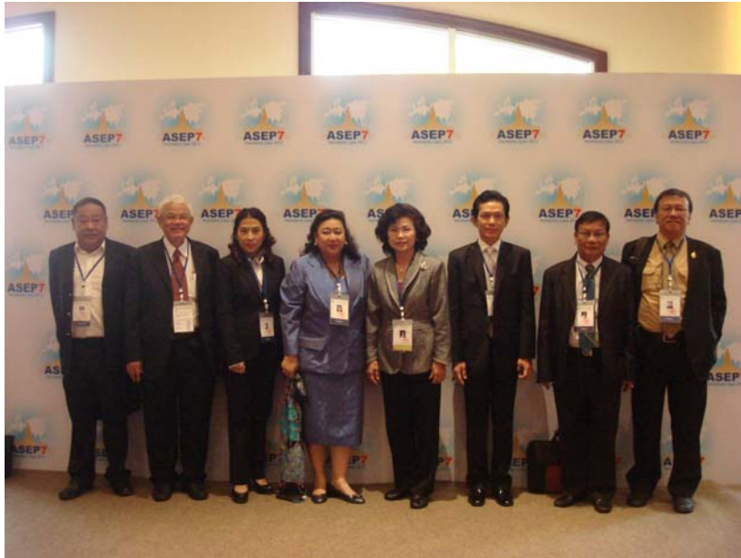
คณะผู้แทนรัฐสภาไทยก่อนการอภิปรายกลุ่มย่อย เมื่อวันที่พฤหัสบดีที่ ๔ ตุลาคม ๒๕๕๕