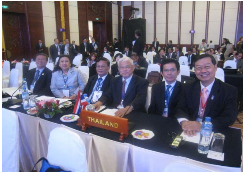
คณะผู้แทนรัฐสภาไทยในระหว่างการประชุมเต็มคณะ วาระที่ ๑ เมื่อวันที่ ๓ ตุลาคม ๒๕๕๕