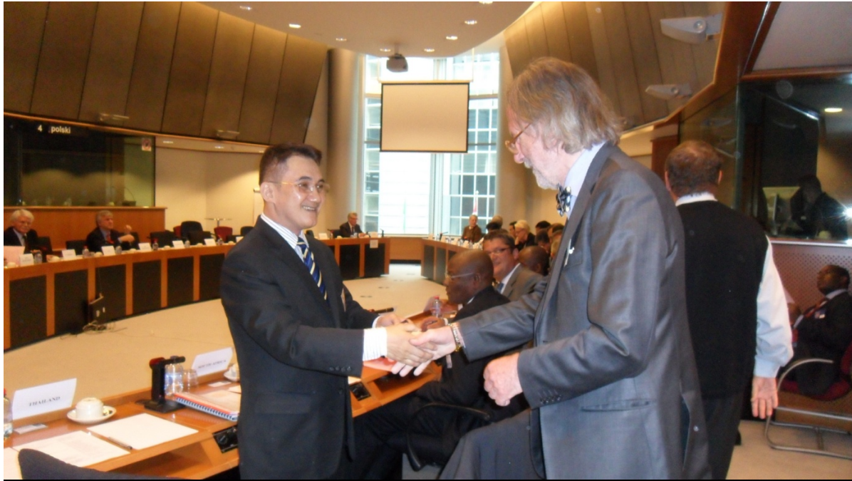
ร้อยตำรวจเอก นิติภูมิ นวรัตน์ หัวหน้าคณะผู้แทนรัฐสภาไทย จับมือทักทายกับนายแอนเดิร์ส บี. จอห์นสัน เลขาธิการสหภาพรัฐสภา ก่อนเริ่มการประชุม