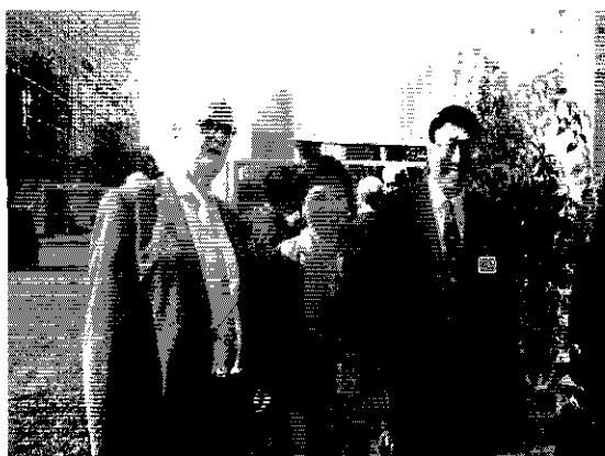
ศาสตราจารย์พิเศษพรเพชร วิชิตชลชัย ประธานสภานิติบัญญัติแห่งชาติ ในฐานะหัวหน้าคณะผู้แทนสภานิติบัญญัติแห่งชาติ เข้าร่วมในพิธีวางแผ่นจารึกต้นไม้ “The Tree of Peace and Unity” บริเวณลานสนามหญ้าข้างอาคารการประชุมสมัชชาใหญ่สหประชาชาติ

ในโอกาสการประชุมประธาณรัฐสภาโลก ครั้งที่ ๔ คณะผู้แทนสภานิติบัญญัติแห่งชาติของไทย ได้ปฏิบัติภารกิจในระหว่างการประชุมได้สำเร็จลุล่วง โดยเฉพาะการแสดงบทบาทในเชิงการทูตรัฐสภา (Parliamentary Diplomacy) ในเวทีการประชุมรัฐสภาระหว่างประเทศที่มีความสำคัญเช่นนี้ บทบาทดังกล่าว รวมถึงการแสดงไมตรีจิตต่อรัฐสภาชาติพันธมิตร การแสวงหาความร่วมมือกับรัฐสภาชาติอื่น ๆ และการสนับสนุนบทบาทของสหภาพรัฐสภาในฐานะองค์การรัฐสภาระหว่างประเทศที่มีคุณูปการต่อความสำเร็จทั้งหลายส่งผลให้รัฐสภาทั่วโลกได้ยืนหยัดและเป็นกระบอกเสียงของประชาชน ซึ่งจะเป็ประโยชน์ต่อการดำเนินความร่วมมือเพื่อมุ่งหน้าสู่การนำเป้าหมายการพัฒนาที่ยั่งยืน หรือ “เป้าหมาย SDGs” ไปปฏิบัติต่อไป