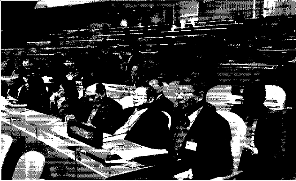
ศาสตราจารย์พิเศษพรเพชร วิชิตชลชัย ประธานสภานิติบัญญัติแห่งชาติ ในฐานะหัวหน้าคณะผู้แทนสภานิติบัญญัติแห่งชาติ พร้อมด้วยคณะผู้แทนสภานิติบัญญัติแห่งชาติ เข้าร่วมการประชุมประธานรัฐสภาโลก ครั้งที่ ๔ ช่วงการอภิปรายทั่วไป (General Debate)

จากนั้นจึงเข้าสู่การอภิปรายทั่วไป (General Debate) ซึ่งเปิดโอกาสให้ประธานรัฐสภาจากรัฐสภาสมาชิกและประธานองค์กรรัฐสภาระหว่างประเทศอื่น ๆ ขึ้นกล่าวถ้อยแถลงในโอกาสการประชุมประธานรัฐสภาโลก ครั้งที่ ๔ โอกาสนี้ ศาสตราจารย์พิเศษพรเพชร วิชิตชลชัย ประธานสภานิติบัญญัติแห่งชาติได้รับฟังสุนทรพจน์ของประธานรัฐสภา และได้เข้าทักทายและแสดงความยินดีกับนายจาง เต๋อเจียง (Mr. Zhang Dejiang) ประธานสภาประชาชนแห่งชาติ สาธารณรัฐประชาชนจีน ภายหลังจากที่นายจาง เต๋อเจียงได้กล่าวสุนทรพจน์เสร็จสิ้น