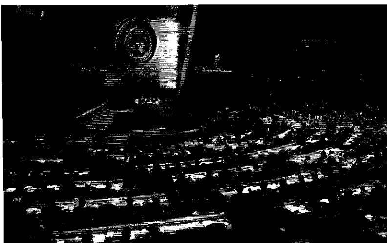
บรรยากาศระหว่างพิธีเปิดการ- ประชุมประธานรัฐสภาโลก ครั้งที่ ๔ ณ ห้องประชุมสมัชชา (General Assembly Hall) อาคารสำนักงาน- ใหญ่สหประชาชาติ