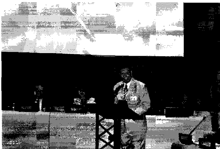
ศาสตราจารย์พิเศษพรเพชร วิชิตชลชัย ประธานสภานิติบัญญัติแห่งชาติ ในฐานะหัวหน้าคณะผู้แทนสภานิติบัญญัติแห่งชาติ กล่าวสุนทรพจน์ในโอกาสการอภิปรายทั่วไป (General Debate)

เมื่อวันที่ ๑ กันยายน ๒๕๕๘ เวลา ๑๒.๓๐ นาฬิกา (เวลาท้องถิ่น ณ นครนิวยอร์ก) ณ ห้องคณะกรรมการทรัสต์ (Trusteeship Council Chamber) ชั้น ๒ อาคารสำนักงานใหญ่สหประชาชาติ ศาสตราจารย์พิเศษพรเพชร วิชิตชลชัย ประธานสภานิติบัญญัติแห่งชาติ ในฐานะหัวหน้าคณะผู้แทนสภานิติบัญญัติแห่งชาติ ได้แสดงบทบาทนำในเวทีการประชุมประธานรัฐสภาโลก ครั้งที่ ๔ ในครั้งนี้ โดยการกล่าวสุนทรพจน์ (Address) ต่อที่ประชุม ทั้งนี้ สารสำคัญของสุนทรพจน์โดยประธานสภานิติบัญญัติแห่งชาติ เกี่ยวข้องกับหลักปรัชญาเศรษฐกิจพอเพียงในพระบาทสมเด็จพระเจ้าอยู่หัว ซึ่งได้ใช้เป็นแนวทางในการพัฒนาเศรษฐกิจของประเทศ และนำไปสู่การพัฒนาที่ยั่งยืน ประชาธิปไตยและการพัฒนาจำเป็นต้องอาศัยการมีส่วนร่วมของประชาชนในทุกภาคส่วน นอกจากนี้ ยังได้ชี้ให้เห็นว่ารัฐสภาสามารถสนับสนุนให้เกิดสันติภาพโดยส่งเสริมให้เกิดการเจรจาเพื่อแก้ไขปัญหาความขัดแย้งในทุกระดับ และในตอนท้ายได้ระบุว่าการประชุมในครั้งนี้ถือว่าเป็นโอกาสในการแลกเปลี่ยนและสั่งสมประสบการณ์ร่วมกัน