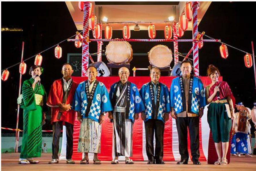
เทศกาลบั้ง โอดริ จัดขึ้นที่กรุงเทพฯ สานสัมพันธ์ทางวัฒนธรรมไทย-ญี่ปุ่น

ญี่ปุ่นสามารถจัดการและควบคุมการผลิตให้กลับคืนมาได้มากขึ้นโดยเร็วเท่าไร ย่อมทำให้การขยายตัวของจีดีพีในไทยปรับตัวเพิ่มขึ้นได้เช่นเดียวกัน ถึงแม้ว่าในขณะนี้ ศูนย์วิจัยกสิกรไทยจะมีการปรับลดอัตราการขยายตัวของจีดีพีลงก็ตาม ท่ามกลางกระแสการแข่งขันทางเศรษฐกิจที่กำลังฟื้นตัวกลับมาในทางบวก โดยเฉพาะอย่างยิ่งเวียดนามที่มีการขยายตัวของจีดีพีสูงกว่าไทยถึงแม้จะได้รับผลกระทบจากโรคโควิด-๑๙ ก็ตาม อย่างไรก็ตาม ภายใต้อุปสงค์ที่เพิ่มขึ้นในการส่งออกในภาคอุตสาหกรรมที่เกี่ยวข้องกับชีวิตความเป็นอยู่หรืออาหารการกินของผู้คน อาจจะทำให้ไทยมีขีดความสามารถในการแข่งขันทางเศรษฐกิจสูงขึ้นทัดเทียมกับเวียดนามก็เป็นได้ ทั้งนี้ จากข้อมูลการสำรวจบริษัทญี่ปุ่นในไทย ทำให้รู้สึกขึ้นใจอยู่บ้างว่า ไทยยังคงเป็นแหล่งการลงทุนที่สำคัญของญี่ปุ่นและมีแนวโน้มที่เพิ่มขึ้นในอนาคตจากมุมมองที่ว่า ไทยเป็นจุดเชื่อมต่อทางยุทธศาสตร์ด้านเศรษฐกิจทั้งทางบก อากาศ และทะเลของภูมิภาคอาเซียน โดยญี่ปุ่นมีมุมมองที่จะถ่ายโอนอำนาจการบริหารให้กับคนไทยแทนที่คนญี่ปุ่นมากขึ้น ถือว่าเป็นสิ่งที่แสดงถึงศักยภาพของคนไทยและความไว้วางใจของชาวญี่ปุ่นที่มีต่อคนไทย ซึ่งหมายถึงความจำเป็นที่ต้องมีการพัฒนาทรัพยากรมนุษย์หรือแรงงานไทยให้มีคุณภาพอย่างต่อเนื่องเพื่อรองรับงานที่จะเกิดขึ้นในอนาคต ซึ่งอาจทำให้มุมมองส่วนที่ว่า “ญี่ปุ่นให้ความสำคัญกับไทยน้อยลง” ปรับเปลี่ยนไปก็เป็นได้ ภายใต้ความผันผวนและความวุ่นวายทางการเมืองของไทย