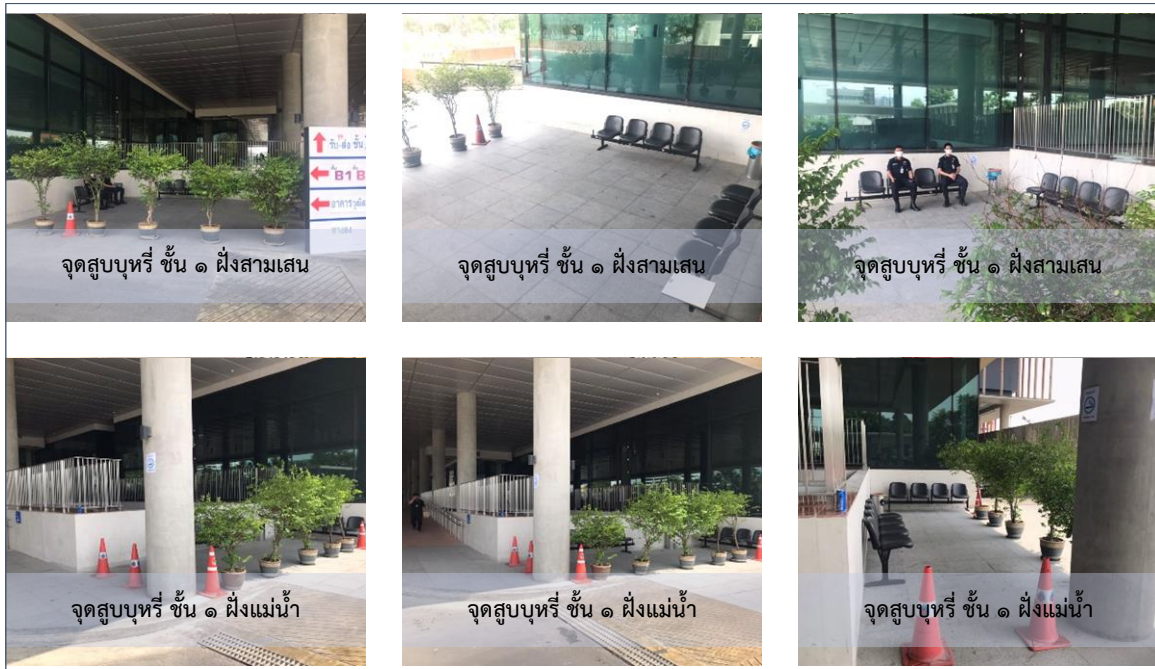
รูปที่ ๓ เขตสุขบุรีภายนอกตัวอาคารสำนักงานเลขาธิการสภาผู้แทนราษฎร

สำนักรักษาความปลอดภัย ได้กำหนดเขตสุขบุรีนอกตัวอาคาร ในบริเวณพื้นที่ด้านข้างทางเข้าอาคาร ชั้น ๑ ฝั่งแม่น้ำและฝั่งถนนสามเสน โดยมีระยะห่างไม่น้อยกว่า ๕ เมตรจากประตูเข้าออก และติดป้ายเขตสุขบุรี พร้อมทั้งตั้งทรายดับบุรี ดังรูปที่ ๓