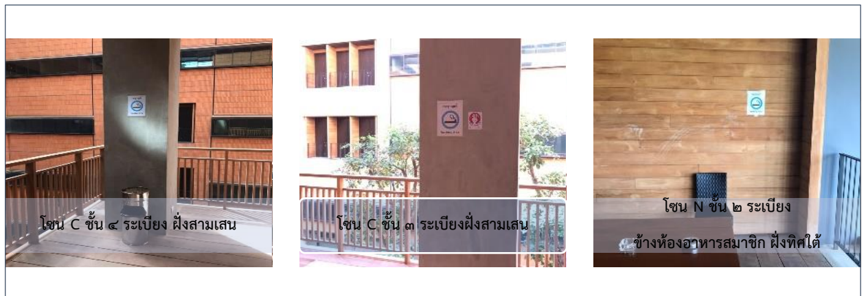
รูปที่ ๒ ตัวอย่างการจัดเขตสุขุบบุหรี ภายในพื้นที่อาคารสำนักงานเลขาธิการสภาผู้แทนราษฎร

เนื่องจากสำนักงานเลขาธิการสภาผู้แทนราษฎร ตั้งอยู่ในอาคารรัฐสภาที่มีพื้นที่ขนาดใหญ่ และใช้ประโยชน์ภายในบริเวณอาคารเป็นหลัก สำนักรักษาความปลอดภัยจึงต้องจัดให้มีเขตสุขุบบุหรี ภายในตัวอาคาร ซึ่งคำนึงถึงการระบายอากาศเป็นหลัก และอยู่ในบริเวณพื้นที่โล่ง เช่น บริเวณโถงระเบียง เป็นต้น โดยได้มีการติดป้ายเขตสุขุบบุหรี พร้อมป้ายรณรงค์ และมีการติดตั้งถังทรายดับบุหรี ดังรูปที่ ๒