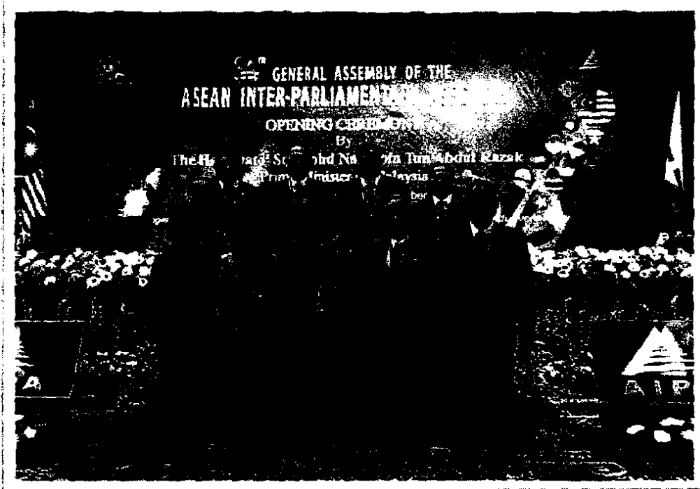
คณะผู้แทนสภานิติบัญญัติแห่งชาติในพิธีเปิดการประชุมใหญ่สมัชชารัฐสภาอาเซียน ครั้งที่ ๓๖

หัวหน้าคณะผู้แทนสภานิติบัญญัติแห่งชาติได้กล่าวสุนทรพจน์ต่อที่ประชุมใหญ่ฯ โดยเน้นย้ำถึงความสำคัญของกรอบความร่วมมือด้านนิติบัญญัติของอาเซียน โดยเล็งเห็นถึงความสำคัญของสมัชชารัฐสภาอาเซียน (ASEAN Inter - Parliamentary Assembly : AIPA) ในการทำหน้าที่เป็นสะพานเชื่อมระหว่างผลประโยชน์ในการเข้าสู่ประชาคมอาเซียนกับประชาชน และบทบาทของ AIPA ในการเป็น “สถาบัน” ทางนิติบัญญัติของภูมิภาค ในขณะที่เดียวกัน AIPA ยังต้องให้ความสำคัญกับการสนับสนุนและอำนวยความสะดวกด้านกฎหมายที่เกี่ยวข้องกับข้อตกลงของอาเซียนเพื่อนำไปสู่การปฏิบัติ และการศึกษาในเชิงลึกเกี่ยวกับการศึกษาเปรียบเทียบข้อกฎหมายของประเทศสมาชิกอาเซียน เพื่อยกระดับการทำงานให้สอดคล้องกับการทำงานร่วมกับอาเซียน ภายหลังจากปี ๒๕๕๘