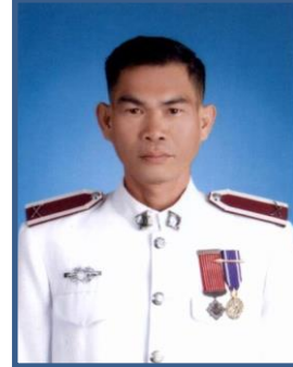
ดาบตำรวจดารากร มังกะโรทัย เลขานุการประจำ คณะกรรมการธิการ