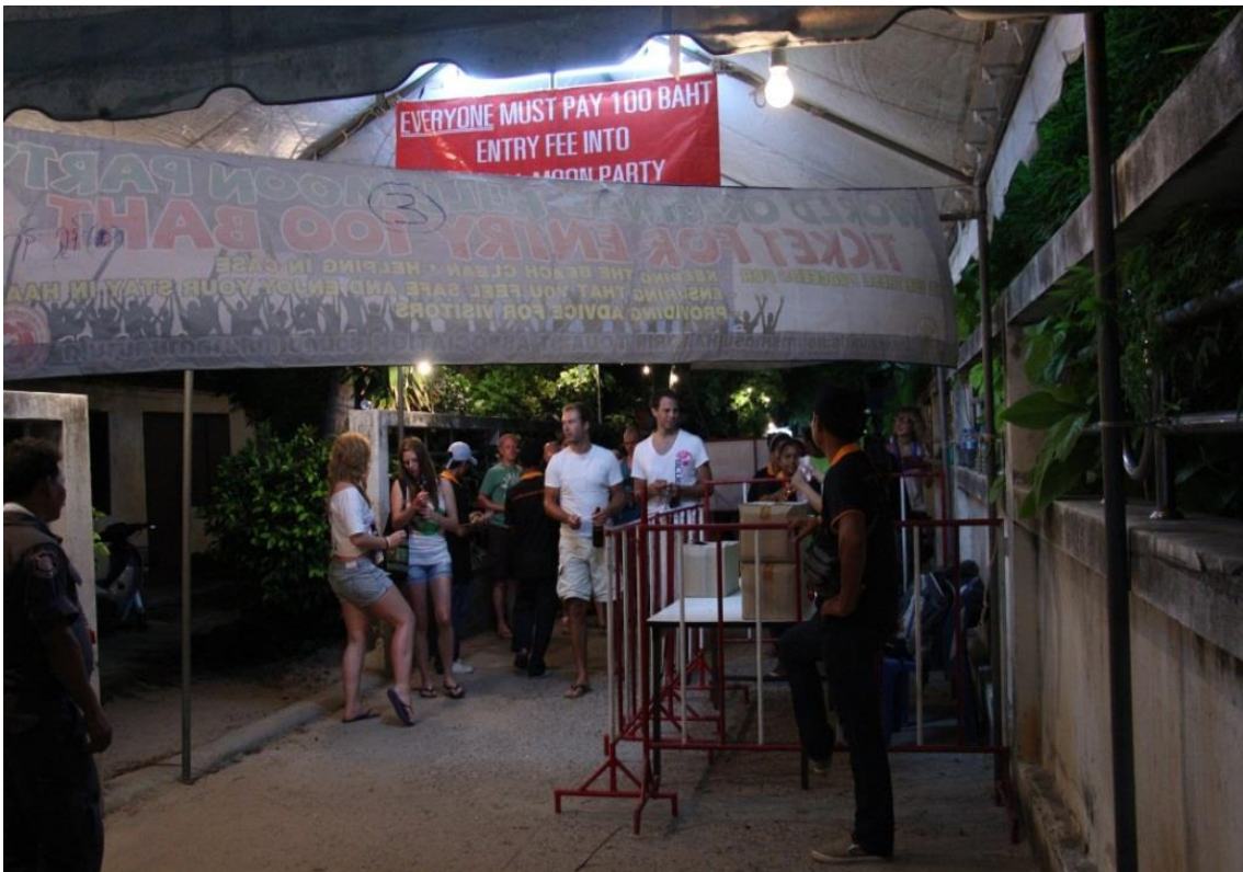
สรุปผลงานคณะกรรมการการป้องกันปราบปราม การฟอกเงินและยาเสพติด ชุดที่ ๒๔