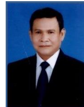
พล.ต.อ.สมพล รัฐกาญจน์