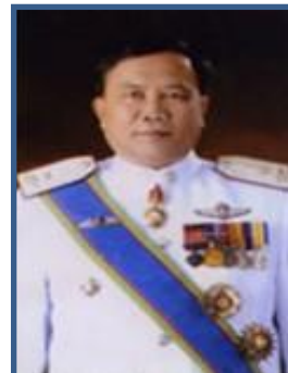
พล.ต.ต. ณัฐวุฒิ พงษ์สิมา