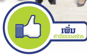
กลุ่มงานส่งเสริมคุณธรรมและจริยธรรม สำนักพัฒนาบุคลากร สำนักงานเลขาธิการสภาผู้แทนราษฎร