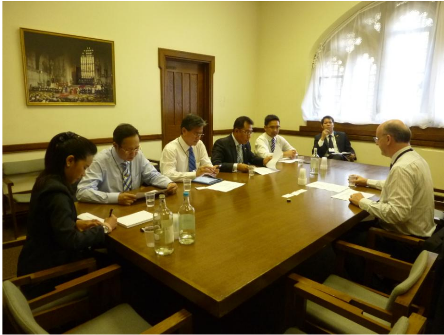
๓.๒ พบปะหารือกับนาย Roger Godsiff ประธานกลุ่มมิตรภาพสมาชิกรัฐสภาสหราชอาณาจักร-ไทย (All Party Parliamentary Group for Thailand-APPGT) และคณะ เมื่อวันที่ ๑๖ กรกฎาคม ๒๕๕๖ เวลา ๑๐.๕๐ นาฬิกา ณ อาคารรัฐสภาสหราชอาณาจักร