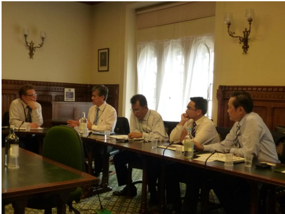
คณะฯ พบปะหารือกับกรรมการการศึกษา สภาผู้แทนราษฎร สหราชอาณาจักร

๓.๓ พบปะหารือกับนาย Craig Whittaker สมาชิกสภาผู้แทนราษฎร และ ประธานกรรมการการศึกษา สภาผู้แทนราษฎร สหราชอาณาจักร และคณะ เมื่อวันที่ ๑๖ กรกฎาคม ๒๕๕๖ เวลา ๑๐.๕๐ นาฬิกา ณ อาคารรัฐสภาสหราชอาณาจักร