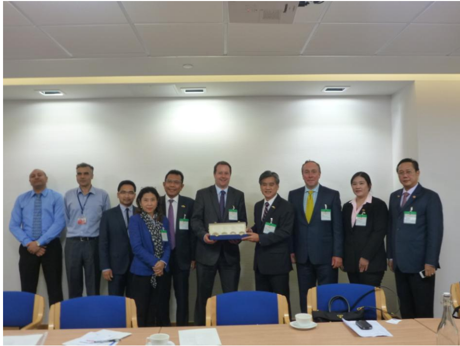
คณะฯ มอบของที่ระลึกให้กับผู้แทนสำนักงาน UK Trade and Investment

๓.๕ พบปะหารือกับผู้แทนนักศึกษาไทยที่ศึกษาในสหราชอาณาจักร เมื่อวันที่ ๑๗ กรกฎาคม ๒๕๕๖ เวลา ๑๖.๐๐ นาฬิกา ณ สำนักงานผู้ดูแลนักเรียนในสหราชอาณาจักร