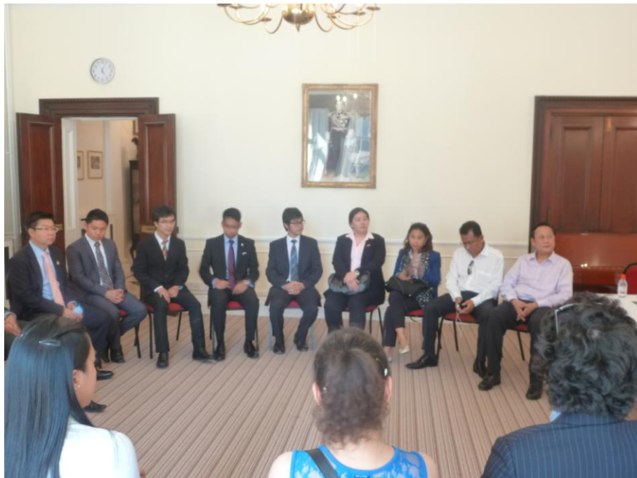
คณะฯ รับฟังข้อคิดเห็นของคณะนักเรียนไทยในสหราชอาณาจักร

๓.๕ พบปะหารือกับผู้แทนนักศึกษาไทยที่ศึกษาในสหราชอาณาจักร เมื่อวันที่ ๑๗ กรกฎาคม ๒๕๕๖ เวลา ๑๖.๐๐ นาฬิกา ณ สำนักงานผู้ดูแลนักเรียนในสหราชอาณาจักร