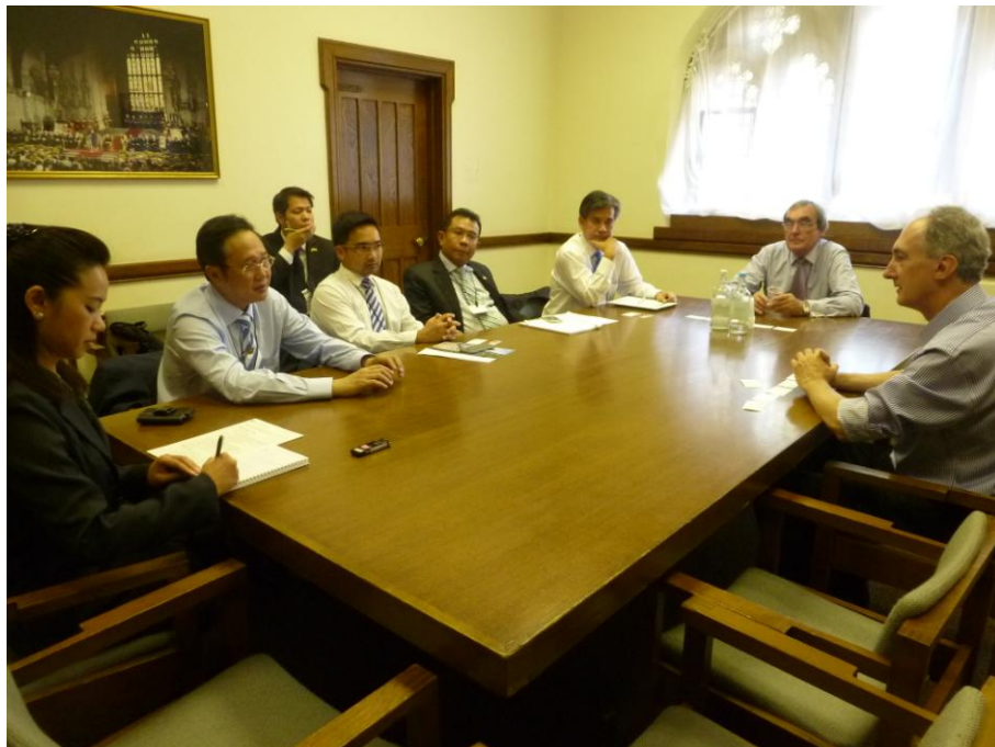
คณะพบปะหารือเกี่ยวกับการกระชับความสัมพันธ์ระหว่างรัฐสภาไทยกับรัฐสภาสหราชอาณาจักร