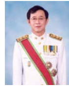
เลขาธิการคณะกรรมการพัฒนา การเศรษฐกิจและสังคมแห่งชาติ