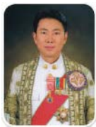
เลขาธิการ สถาบันพระปกเกล้า