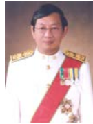
เลขาธิการคณะกรรมการ กฤษฎีกา