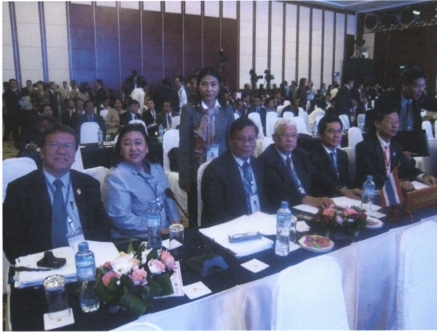
คณะผู้แทนรัฐสภาไทยในระหว่างการประชุมเต็มคณะ วาระที่ ๑ เมื่อวันพุธที่ ๓ ตุลาคม ๒๕๕๕