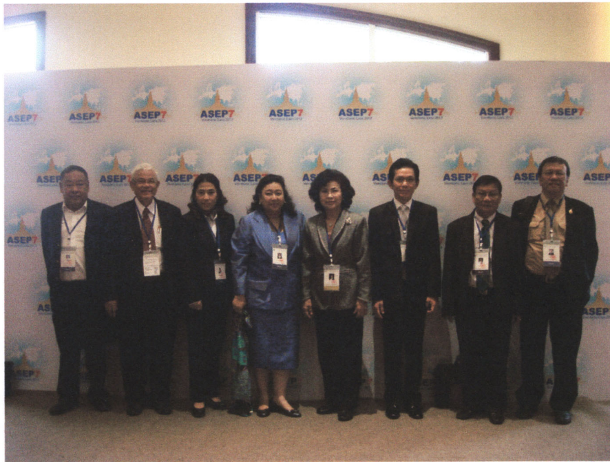
คณะผู้แทนรัฐสภาไทยก่อนการอภิปรายกลุ่มย่อย เมื่อวันพฤหัสบดีที่ ๔ ตุลาคม ๒๕๕๕