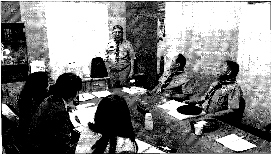
คณะผู้แทนสถานติบัญญัติแห่งชาติ หารือเรื่องการเตรียมการเป็นเจ้าภาพจัดการประชุมสมัชชาใหญ่-สหภาพลูกเสือรัฐสภาโลก ครั้งที่ ๙ ณ กรุงเทพมหานคร ร่วมกับ คณะผู้แทนจากสำนักงานเลขาธิการ-ลูกเสือรัฐสภาโลก (WSPU) และสำนักงานเลขาธิการลูกเสือรัฐสภาเกาหลี (KSPA) ณ สำนักงานเลขาธิการลูกเสือรัฐสภาโลก กรุงโซล สาธารณรัฐเกาหลี