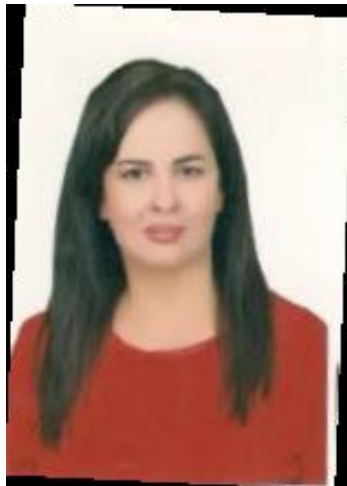
นาง Maysaa Saleh หัวหน้าคณะผู้แทนรัฐสภาซีเรีย

สำหรับวิกฤตการณ์การแพร่ระบาดของโรคโควิด-๑๙ ทุกฝ่ายจะต้องร่วมมือกันโดยต้องสามารถยืนหยัดรับมือกับการเผชิญหน้าความท้าทายนี้ได้โดยไม่ต้องพึ่งพาอาศัยความช่วยเหลือจากกลุ่มประเทศตะวันตกเพียงอย่างเดียว และต้องให้ความสำคัญกับปัญหาสุขภาพจิตในระดับครอบครัว โดยเฉพาะอย่างยิ่งภายใต้วิกฤตการณ์นี้