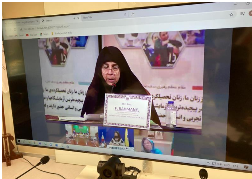
นาง FATEMEH RAHMANI สมาชิกรัฐสภาสตรีอิหร่าน

นาง FATEMEH RAHMANI สมาชิกวุฒิสภาสตรีอิหร่าน ได้ร่วมกล่าวถ้อยแถลงต่อที่ประชุม โดยมีเนื้อหาสรุป ดังนี้