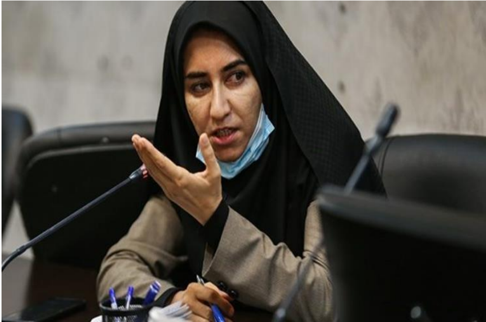
นาง SARA FALLAHI สมาชิกรัฐสภาสตรีอิหร่าน

- การเปลี่ยนแนวทางและนโยบาย รวมถึงการริเริ่มโครงการที่เป็นประโยชน์สำหรับสตรีเป็นสิ่งที่จำเป็นในการสนับสนุนและให้สิทธิสตรีผู้มีหน้าที่หาเลี้ยงครอบครัว อีกทั้งยังเป็นการเพิ่มขีดความสามารถทางเศรษฐกิจของสตรีเช่นกัน