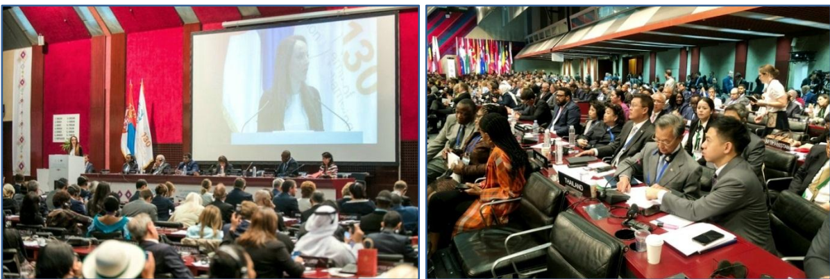
(ขวา) ประธานรัฐสภาร่วมลงมติในนามคณะผู้แทนไทยเพื่อเลือกหัวข้อเป็นระเบียบวาระเร่งด่วน (Emergency Item)

คณะผู้แทนรัฐสภาไทย นำโดยนายชวน หลีกภัย ประธานรัฐสภาและประธานสภาผู้แทนราษฎร เข้าร่วมการประชุมสมัชชาสหภาพรัฐสภา ครั้งที่ ๑๔๑ (The 141 st IPU Assembly) เป็นเวลา ๔ วัน ตั้งแต่วันที่ ๑๔ - ๑๗ ตุลาคม ๒๕๖๒ ณ ห้องประชุม ๑/๐ อาคาร A ศูนย์การประชุม Sava Centre กรุงเบลเกรด สาธารณรัฐเซอร์เบีย