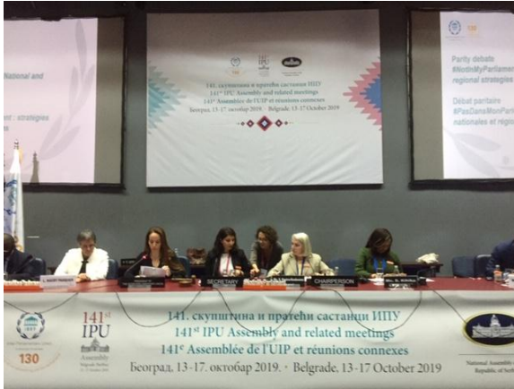
บรรยากาศการอภิปรายที่ทุกฝ่ายมีส่วนร่วม