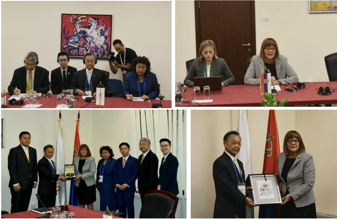
นายชวน หลีกภัย ประธานรัฐสภาและประธานสภาผู้แทนราษฎร นำคณะผู้แทนรัฐสภาไทย เข้าร่วมการประชุมหรือทวิภาคีกับ นางสาวมายา กอยโควิช (Ms. Maja Gojkovic) ประธานรัฐสภาเซอร์เบีย

ประธานรัฐสภา ได้กล่าวขอบคุณประธานรัฐสภาเซอร์เบียที่ได้สละเวลาเพื่อพบปะหารือในเวลานี้ โดยทราบว่าประธานรัฐสภาเซอร์เบียมีภารกิจค่อนข้างมากในฐานะที่เป็นเจ้าภาพจัดการประชุม และกล่าวขอบคุณรัฐสภาเซอร์เบียในฐานะประเทศเจ้าภาพสำหรับการต้อนรับอย่างอบอุ่น การอำนวยความสะดวกและการอารักขาที่ จัดทำให้เป็นกรณีพิเศษแก่ประธานรัฐสภา อีกทั้ง ได้กล่าวชื่นชมรัฐสภาเซอร์เบียที่จัดการประชุมสมัชชาในครั้งนี้ได้ อย่างดียิ่ง และอวยพรให้การประชุมในครั้งนี้อาจบรรลุไปด้วยดี นอกจากนี้ ประธานรัฐสภายังได้กล่าวชื่นชมประธาน รัฐสภาเซอร์เบีย ว่าเป็นสตรีที่มีความสามารถสูงและได้รับความไว้วางใจจากประชาชนให้ดำรงตำแหน่งประธานรัฐสภาถึง สองสมัยติดต่อกัน และได้อวยพรให้ประธานรัฐสภาเซอร์เบียประสบความสำเร็จในการเลือกตั้งที่จะมีขึ้นในปีหน้า สุดท้าย นายชวน หลีกภัย กล่าวเชิญให้ประธานรัฐสภาเซอร์เบียเดินทางเยือนประเทศไทย เพื่อพัฒนาความสัมพันธ์ ระหว่างรัฐสภาทั้งสองประเทศให้แน่นแฟ้นยิ่งขึ้นต่อไป