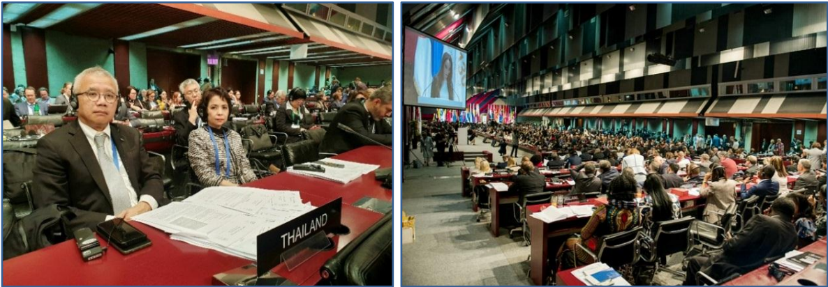
คณะผู้แทนรัฐสภาไทยเข้าร่วมการประชุมคณะมนตรีบริหารสหภาพรัฐสภา (วาระที่สอง ๑๗ ตุลาคม ๒๕๖๒)

๒๕๕๗ ทั้งนี้ เพื่อมิให้ไทยต้องถูกระงับสมาชิกภาพ สหภาพรัฐสภาจึงได้พยายามรักษาปฏิสัมพันธ์อย่างต่อเนื่องกับ สภานิติบัญญัติแห่งชาติในช่วงเปลี่ยนผ่าน เพื่อติดตามความก้าวหน้าตามโรดแมปประชาธิปไตย โดยสหภาพรัฐสภา ได้รับทราบด้วยความยินดีว่ารัฐสภาชุดใหม่ของไทยมีสมาชิกรัฐสภาสตรีและยุวสมาชิกรัฐสภา (Young MPs) ซึ่งเป็น คนรุ่นใหม่จำนวนมาก โดยสหภาพรัฐสภาพร้อมให้ความร่วมมือกับรัฐสภาชุดใหม่ของไทยในการจรรโลงประชาธิปไตยของ ไทยให้มีความมั่นคงและยั่งยืนต่อไป ต่อมา คณะผู้แทนรัฐสภาโปรตุเกสได้เสนอแปรญัตติให้ที่ประชุมพิจารณาลงมติ ตัดสินว่าที่ประชุมจะเห็นด้วยหรือไม่เห็นด้วยกับการรับรองข้อเสนอแนะของคณะกรรมการบริหารสหภาพรัฐสภา (Executive Committee) เกี่ยวกับกรณีสถานการณ์ของรัฐสภาในเยเมนซึ่งที่ประชุมได้ลงมติแบบขานชื่อที่ละประเทศ (Roll-call vote) และเสียงข้างมากของที่ประชุมเห็นด้วยให้รับรองข้อเสนอแนะดังกล่าวของคณะกรรมการบริหารฯ ด้วยคะแนนเสียงเห็นชอบ ๑๐๔ คะแนน ต่อคะแนนเสียงไม่เห็นชอบ ๒๔ คะแนนและงดออกเสียง ๓๙ คะแนน