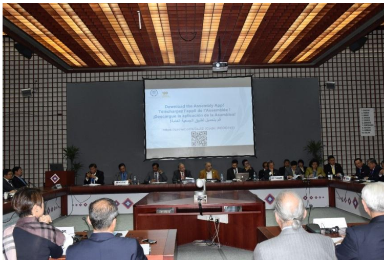
บรรยากาศการประชุมกลุ่มอาเซียน+๓

ในช่วงท้ายของการประชุมฯ ประธานแจ้งให้ที่ประชุมทราบว่าประธานการประชุมกลุ่มอาเซียน+๓ ในการประชุมสมัชชาสหภาพรัฐสภา ครั้งที่ ๑๔๒ คือ รัฐสภาสิงคโปร์