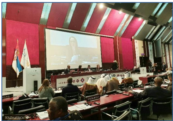
คณะผู้แทนรัฐสภาไทยเข้าร่วมการประชุมคณะมนตรีบริหารสหภาพรัฐสภา (วาระแรก ๑๔ ตุลาคม ๒๕๖๒)