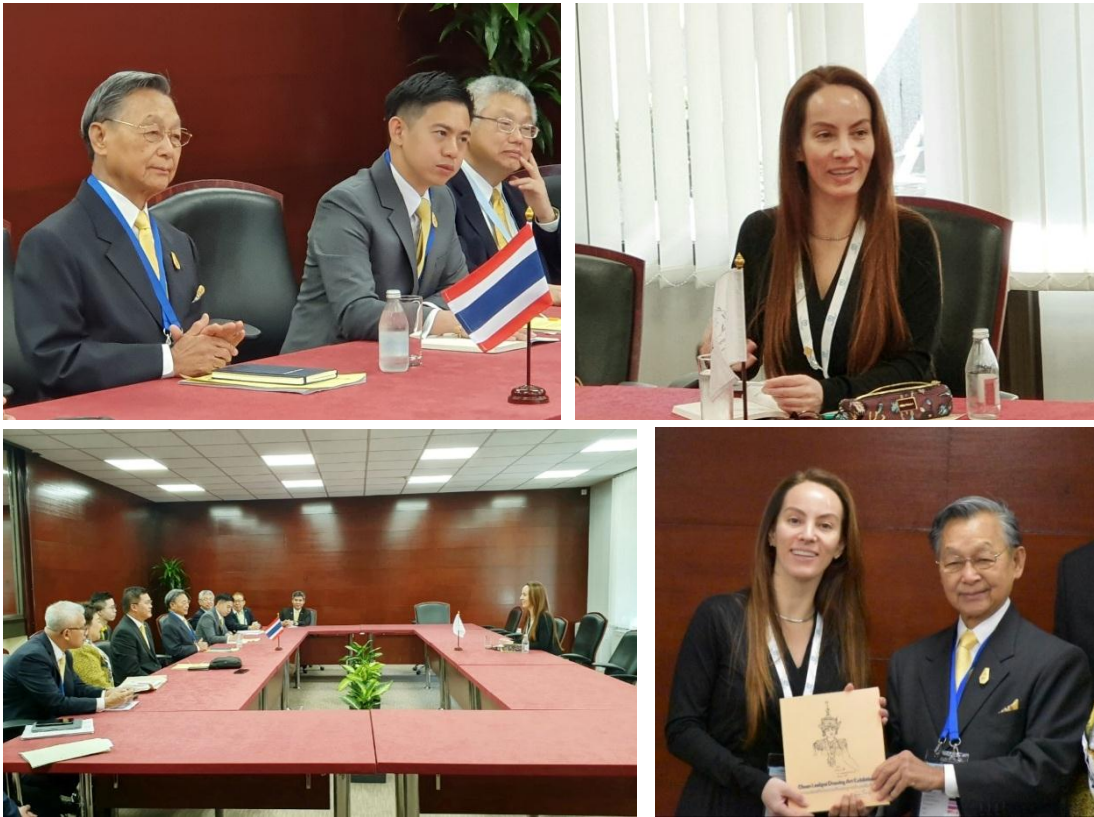
นายชวน หลีกภัย ประธานรัฐสภาและประธานสภาผู้แทนราษฎร นำคณะผู้แทนรัฐสภาไทย เข้าร่วมการประชุมหารือกับ นางสาวกาเบรียลลา กูเอบัส บาร์รอน (Ms. Gabriela Cuevas Barron) ประธานสภาพรรคสภา

ในประเด็นเรื่องความเสมอภาคของหญิง-ชาย ประธานรัฐสภาได้แจ้งต่อประธานสภาพรรคสภาว่า ประเทศไทยมีความก้าวหน้าในเรื่องนี้สูงมาก โดยเฉพาะอย่างยิ่งสัดส่วนของหญิงชายในฝ่ายข้าราชการประจำระดับสูง มีสัดส่วนที่สูงใกล้เคียงกันมาก ซึ่งถือเป็นเรื่องน่ายินดีอย่างยิ่ง จากนั้น ประธานรัฐสภาได้สอบถามถึงการทำหน้าที่ของประธานสภาพรรคสภาว่ามีเคล็ดลึบอย่างไรในการรักษาสมดุลการทำหน้าที่ระหว่างการเป็นประธานสภาพรรคสภา และการเป็นสมาชิกวุฒิสภาของเม็กซิโก โดยประธานสภาพรรคสภาได้กล่าวว่าการทำหน้าที่ในฐานะประธานสภาพรรคสภา เป็นไปอย่างราบรื่น เนื่องจากมีคณะทำงานที่เข้มแข็งและมีประสิทธิภาพ ขณะที่การปฏิบัติหน้าที่ในฐานะสมาชิกวุฒิสภา อาจประสบปัญหาบ้างเล็กน้อย เนื่องจากประชาชนในเขตเลือกตั้งของตนอาจไม่เข้าใจถึงบทบาทหน้าที่การทำงานในฐานะประธานสภาพรรคสภาในบริบทของเวทีพหุภาคีและความร่วมมือระหว่างประเทศเท่าใดนัก ซึ่งประธานสภาพรรคสภา มีหน้าที่ที่จะต้องสร้างความรู้ความเข้าใจแก่ประชาชนต่อไป อีกทั้ง ปัจจุบันเม็กซิโกกำลังเผชิญอุปสรรคบางประการจากการสร้างวาทกรรมเหยียดเชื้อชาติ หรือวาทกรรมสร้างความเกลียดชังจากคนบางกลุ่มในสหรัฐอเมริกาที่เป็นประเทศที่มีพรมแดนติดกับเม็กซิโก ซึ่งเป็นประเด็นที่เม็กซิโกจะต้องรับมือแก้ปัญหาต่อไป ในตอนท้าย ทั้งสองฝ่ายต่างแสดงความยินดี และมุ่งหวังที่จะร่วมแรงร่วมใจทำงานเพื่อความสำเร็จของสภาพรรคสภา และประโยชน์สุขของประชาชนทุกคนต่อไป ในอนาคต