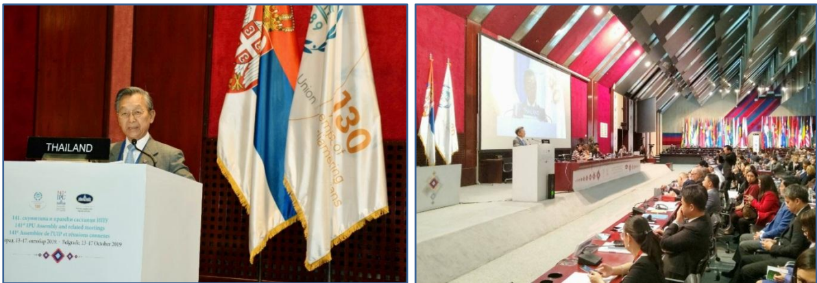
ประธานรัฐสภากล่าวถ้อยแถลงในนามคณะผู้แทนรัฐสภาไทยต่อที่ประชุมสมัชชา IPU ครั้งที่ ๑๔๑

นอกจากนี้ประเทศไทยยังมีความก้าวหน้าในการดำเนินการเพื่อบรรลุเป้าหมายการพัฒนาที่ยั่งยืนของสหประชาชาติ (SDGs) ด้วยการน้อมนำหลักปรัชญาเศรษฐกิจพอเพียงของสมเด็จพระบรมชนกนาถิเบศร มหาภูมิพลอดุลยเดชมหาราช บรมนาถบพิตร เป็นแกนหลักในการขับเคลื่อนการบรรลุ SDGs ของประเทศ และเน้นย้ำถึงบทบาทสำคัญของรัฐสภาในการออกแบบกรอบกฎหมายเพื่อให้สอดคล้องกับพันธะสัญญาที่ให้ไว้กับประชาชน และสอดคล้องกับพันธกรณีระหว่างประเทศของไทยด้วย ประเทศไทยให้ความสำคัญอย่างยิ่งต่อสหประชาชาติตลอดจนวาระสำคัญของสหประชาชาติ อาทิ การคุ้มครองสิทธิมนุษยชน การส่งเสริมความมั่นคงของมนุษย์ การอนุรักษ์สิ่งแวดล้อม และการสนับสนุนกระบวนการรักษาสันติภาพของ UN โดยประเทศไทยยังคงยึดมั่นในพันธกรณีของไทยภายใต้กฎบัตรสหประชาชาติและกฎบัตรอาเซียน ด้วยไทยเชื่อว่าระเบียบกฎหมายระหว่างประเทศเป็นหลักยึดเหนี่ยวสำคัญที่ปกป้องคุ้มครองเอกราชและอธิปไตยของทุกประเทศ