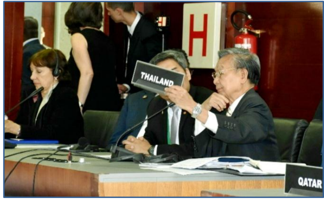
ประธานรัฐสภาเข้าร่วมการประชุมเสวนาโต๊ะกลมของประธานรัฐสภา (Speakers' Dialogue)