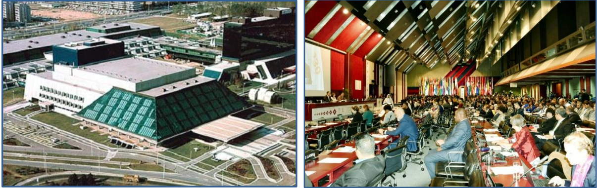
ศูนย์การประชุม Sava Centre กรุงเบลเกรด

ตั้งแต่วันที่ ๑๒ - ๑๙ ตุลาคม ๒๕๖๒ โดยคณะผู้แทนรัฐสภาไทยได้รับการต้อนรับ ดูแลอำนวยความสะดวกเป็นอย่างดีจากรัฐสภาเซอร์เบียในฐานะประเทศเจ้าภาพ ซึ่งได้จัดเจ้าหน้าที่ประสานงาน (Liaison officer) และเจ้าหน้าที่รักษาความปลอดภัยประจำตัวหัวหน้าคณะฯ ติดตามคณะฯ พร้อมทั้งจัดรถยนต์รับรองสำหรับหัวหน้าคณะฯ และรถตำรวจนำขบวนตลอดระยะเวลาของการประชุม