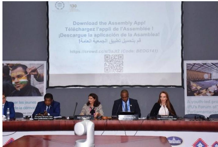
ช่วงเปิดการประชุมยุวมหาชิกรัฐสภา โดยมีประธานสหภาพรัฐสภา (ชาวสวิตเซอร์แลนด์) และเลขาธิการสหภาพรัฐสภา (ช้ายสวิตเซอร์แลนด์) เข้าร่วม

ระเบียบวาระการประชุมที่สำคัญ ได้แก่ (๑) การรายงานความคืบหน้ารายประเทศในเรื่องการมีส่วนร่วมของเยาวชน ซึ่งยุวมหาชิกรัฐสภาที่เข้าร่วมการประชุมจะมีโอกาสอภิปรายเพื่อสะท้อนความสำเร็จ ความท้าทายและให้ข้อเสนอแนะในประเด็นดังกล่าว (๒) การมีส่วนร่วมกับการกิจของการประชุมสมัชชาสหภาพรัฐสภา ครั้งที่ ๑๔๑ ซึ่งมีการแลกเปลี่ยนมุมมองของยุวมหาชิกรัฐสภาภายใต้หัวข้อหลักของการอภิปรายทั่วไป (General Debate) ของที่ประชุมสมัชชาฯ ว่าด้วยเรื่อง “การสร้างความแข็งแกร่งของกฎหมายระหว่างประเทศ: บทบาทและกลไกของรัฐสภา และการมีส่วนร่วมของความร่วมมือระดับภูมิภาค” รวมถึงมุมมองของยุวมหาชิกรัฐสภาเกี่ยวกับร่างข้อมติโดยคณะกรรมการสามัญ ว่าด้วยประชาธิปไตยและสิทธิมนุษยชน ว่าด้วยเรื่อง “บทบาทของรัฐสภาในการส่งเสริมการมีสุขภาพที่ดีเพื่อบรรลุเป้าหมายหลักประกันสุขภาพถ้วนหน้าภายในปี ๒๕๗๓” ด้วย และ (๓) การถาม-ตอบด้านนโยบายเยาวชน ที่ประชุมจะได้อภิปรายเพื่อแลกเปลี่ยนเรียนรู้แนวปฏิบัติที่ดีในการกำหนดนโยบายเยาวชน โดยเฉพาะอย่างยิ่งมุมมองของยุวมหาชิกรัฐสภาในการส่งเสริมนโยบายและออกกฎหมายเพื่อเสริมสร้างความแข็งแกร่งให้แก่เยาวชน และการมีส่วนร่วมทางการเมืองของเยาวชน