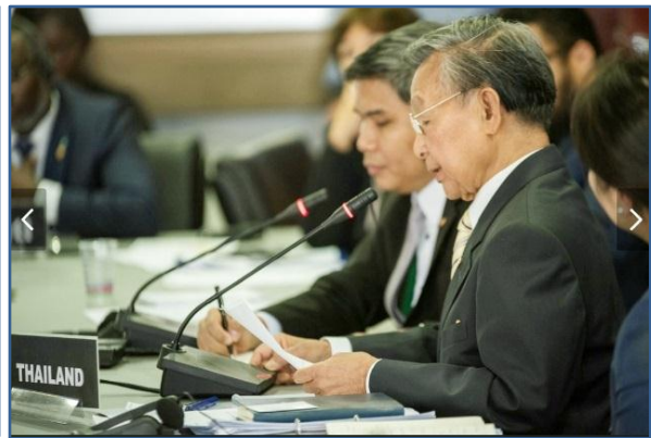
(ซ้าย) Ms. Gabriela Cuevas Barron ประธานสหภาพรัฐสภาทำหน้าที่ประธานการประชุม Speakers' Dialogue (ขวา) ประธานรัฐสภาร่วมกล่าวอภิปรายแลกเปลี่ยนความคิดเห็นต่อที่ประชุมเสวนาโต๊ะกลมของประธานรัฐสภา

ในการนี้ ประธานรัฐสภาได้ร่วมอภิปรายแลกเปลี่ยนกับที่ประชุมโดยมีสาระสำคัญว่า จากประสบการณ์การเมืองอันยาวนานกว่า ๕๐ ปีของตนในฝ่ายนิติบัญญัติในฐานะสมาชิกสภาผู้แทนราษฎร ๑๖ สมัย ประธานสภาผู้แทนราษฎร ๒ สมัย และผู้นำฝ่ายค้าน ๓ สมัย รวมถึง ประสบการณ์ในฝ่ายบริหารในฐานะนายกรัฐมนตรี ๒ สมัย และรัฐมนตรีอีกหลายกระทรวง ได้ค้นพบข้อสรุปว่า ภาครัฐสภาจะต้องได้รับความร่วมมือจากฝ่ายบริหารในฐานะผู้นำนโยบายไปปฏิบัติ และฝ่ายบริหารจะต้องได้รับความร่วมมือจากฝ่ายนิติบัญญัติในฐานะผู้ตรากฎหมาย ผู้กำกับตรวจสอบ และผู้จัดสรรงบประมาณด้วย จึงจะสามารถร่วมกันแก้ไขปัญหาของประชาชนได้อย่างเป็นรูปธรรม โดยสมาชิกรัฐสภาซึ่งทำงานใกล้ชิดกับประชาชนจะเป็นผู้สื่อสารปัญหาและความต้องการของประชาชนไปให้รัฐบาลได้รับทราบผ่านกลไกรัฐสภา โดยเมื่อครั้งที่ตนได้ทำหน้าที่ในฝ่ายบริหาร มีนโยบายหลายเรื่องที่ได้รับการผลักดันและยังคงมีผลจนถึงปัจจุบัน อาทิ นโยบายโครงการนมโรงเรียน และนโยบายกองทุนกู้ยืมเพื่อการศึกษา เป็นต้น นอกจากนี้ การจัดการปัญหาการทุจริตคอร์รัปชันและธรรมาภิบาลถือเป็นเรื่องสำคัญที่จะช่วยลดปัญหาการเมืองไม่สุจริต และปัญหาธนกิจการเมือง (money politics) โดยหลักนิติธรรมที่วางอยู่บนการบังคับใช้กฎหมายอย่างเคร่งครัดและเสมอภาคจะช่วยลดปัญหาความเหลื่อมล้ำทางเศรษฐกิจและสังคมลงได้ ดังคำกล่าวที่ว่า "เราไม่สามารถทำให้ทุกคนร่ำรวยเท่าเทียมกันได้ แต่สามารถทำให้ทุกคนเท่าเทียมกันภายใต้กฎหมายได้"