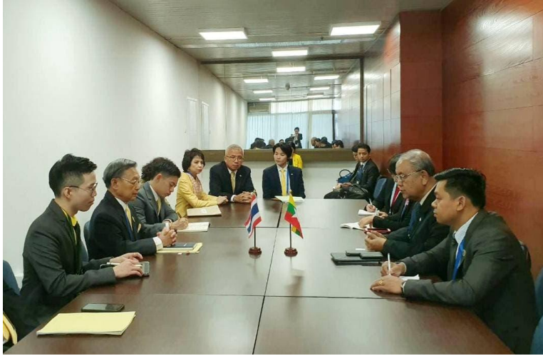
คณะผู้แทนรัฐสภาไทย นำโดยประธานรัฐสภา พบปะหารือทวิภาคีกับคณะผู้แทนรัฐสภาเมียนมา