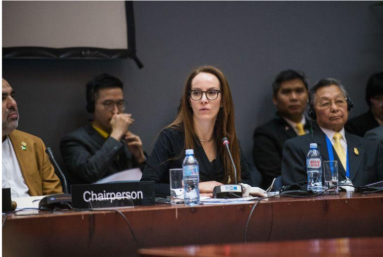
Ms. Gabriela Cuevas Barron ประธานรัฐสภาสหภาพรัฐสภา (ที่สองจากซ้าย) ให้เกียรติเข้าร่วมการประชุมกลุ่มภูมิรัฐศาสตร์ เอเชีย-แปซิฟิก

ประธานที่ประชุมได้แจ้งให้ที่ประชุมฯ ทราบว่าประธานการประชุมกลุ่มภูมิรัฐศาสตร์เอเชีย-แปซิฟิก ในปี ๒๕๖๓ คือ รัฐสภาฟิลิปปินส์