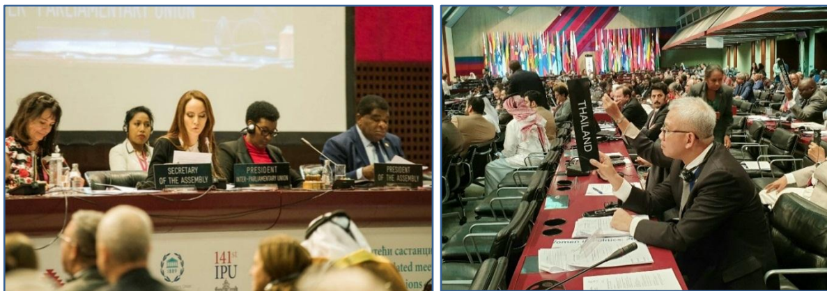
(ขวา) คณะผู้แทนรัฐสภาไทยร่วมลงคะแนนเสียงเห็นชอบรับรองข้อเสนอแนะของ คณะกรรมการบริหารว่าด้วยกรณีเยเมน