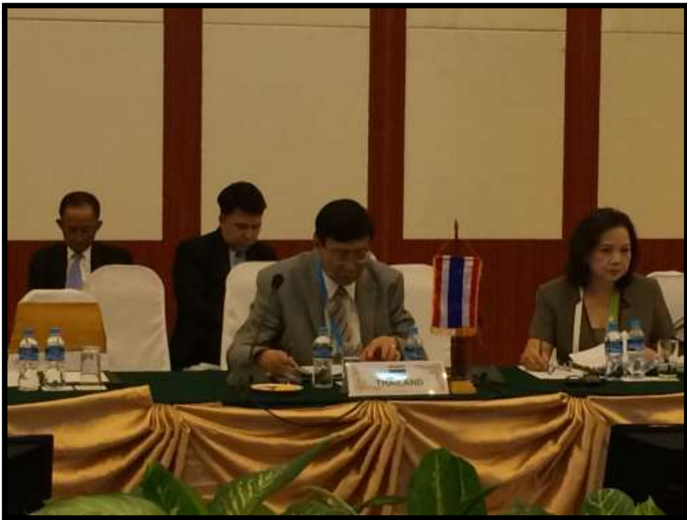
ศาสตราจารย์พิเศษพรเพชร วิชิตชลชัย ประธานสภานิติบัญญัติแห่งชาติ ในการประชุมเตรียมการของสมัชชารัฐสภาอาเซียน

การประชุมเตรียมการของคณะผู้แทน AIPA มีขึ้นในวันที่ ๕ กันยายน ๒๕๕๙ เพื่อให้ประเทศสมาชิกร่วมกันพิจารณาร่างคำกล่าวของประธาน AIPA ซึ่งจะใช้กล่าวในการประชุมกับผู้นำอาเซียนในวันที่ ๖ กันยายน ๒๕๕๙ โดยมีนางปานี ยาทอตู ประธานสภาแห่งชาติสาธารณรัฐประชาธิปไตยประชาชนลาว ในฐานะประเทศเจ้าภาพจัดการประชุมกล่าวต้อนรับคณะผู้แทนจากรัฐสภาสมาชิก AIPA และนายอิมอฮิซุม บิน อิบราฮิม หัวหน้าคณะผู้แทนรัฐสภามาเลเซีย กล่าวเปิดการประชุมในนามของนาย ตัน ศรี ดาตุ๊ก ปันติกา อามิน มูเลีย ประธานสภาผู้แทนราษฎรอินโดนีเซีย ใจความกล่าวถึงความสำคัญของการประชุมระหว่างคณะผู้แทน AIPA และผู้นำอาเซียนเป็นช่องทางการติดต่ออย่างเป็นทางการระหว่างฝ่ายบริหารและฝ่ายนิติบัญญัติ และในถ้อยแถลงของประธาน AIPA ควรให้ความสำคัญกับการส่งเสริมความร่วมมือที่ต่อเนื่อง และการยกระดับการทำงานร่วมกันระหว่างสำนักงานเลขาธิการ AIPA และสำนักงานเลขาธิการอาเซียนเพื่อเชื่อมโยงการทำงานให้มากยิ่งขึ้น