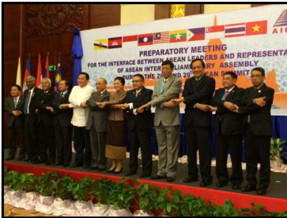
คณะผู้แทนสมัชชารัฐสภาอาเซียนถ่ายรูปร่วมกัน ภายหลังเสร็จสิ้นการประชุมเตรียมการของคณะผู้แทน AIPA

๒. การยกระดับการทำงานสำนักงานเลขาธิการ AIPA และสำนักงานเลขาธิการอาเซียนไปสู่การประสานงานและปรึกษาหารือที่ถาวร เพื่อนำไปสู่การขยายขอบเขตการทำงานและการแลกเปลี่ยนข้อมูลระหว่าง ๒ องค์กรในระดับของฝ่ายปฏิบัติงาน