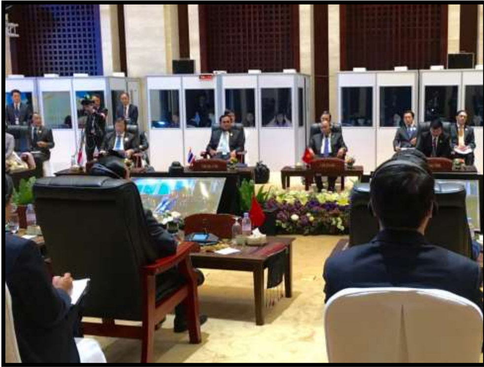
บรรยากาศในการประชุมคณะผู้แทน AIPA และผู้นำอาเซียน

ในตอนท้าย ประธาน AIPA ได้กล่าวขอบคุณนายทองลุน สีสุลิด นายกรัฐมนตรีสาธารณรัฐประชาธิปไตยประชาชนลาว ในฐานะประธานอาเซียน ที่ให้การต้อนรับคณะผู้แทนของ AIPA ตลอดระยะเวลาในการเข้าร่วมการประชุมสุดยอดอาเซียน ณ เวียงจันทน์