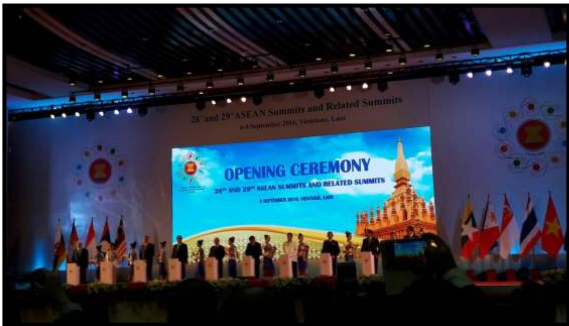
พิธีเปิดการประชุมสุดยอดอาเซียน ครั้งที่ ๒๘ - ๒๙

พิธีเปิดการประชุมมีขึ้นในวันที่ ๖ กันยายน ๒๕๕๙ ณ ศูนย์ประชุมแห่งชาติลาว โดยมีนายทองลุน สีสุลิด นายกรัฐมนตรีแห่งสาธารณรัฐประชาธิปไตยประชาชนลาว ในฐานะประธานอาเซียนเป็นประธานในพิธีเปิดการประชุม พร้อมด้วยผู้นำจากอาเซียน ๙ ประเทศ นายบุญยัง วอลละจิต ประธานประเทศลาวกล่าวปาฐกถาต่อที่ประชุม ในโอกาสนี้ ศาสตราจารย์พิเศษพรเพชร วิชิตชลชัย ประธานสมานิติบัญญัติแห่งชาติ และภริยา ได้เข้าร่วมพิธีเปิดการประชุมด้วย