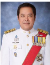
พันตำรวจเอก ทวี สอดส่อง รองประธานคณะกรรมการธิการ คนที่ยี่สิบสาม