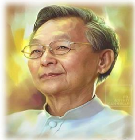
H.E. Mr. Chuan Leekpai

(ท่านใดดำรงตำแหน่งประธานรัฐสภาในปัจจุบัน)