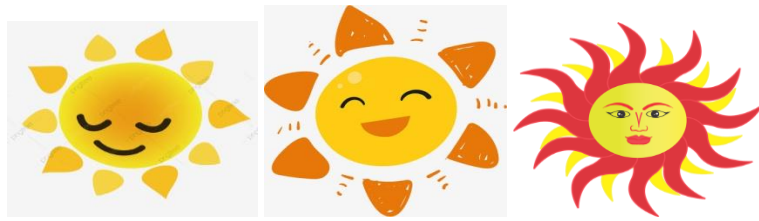
“Phra Suriyan” (ห้องพระสุริยัน)