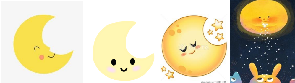
“Phra Chantra” (ห้องพระจันทร์)

What is the name of the Senate Chamber ? (ห้องประชุมวุฒิสภา มีชื่อว่าอะไรเอ่ย)