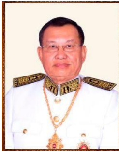
สมเด็จพระวิบูลย์เสนาภักดี สาย ชุม (Samdech Vibol Sena Pheakdei Say Chhum) ๖ ประธานวุฒิสภา

วุฒิสภาแห่งราชอาณาจักรกัมพูชา ชุดที่ ๓ ๕ ประกอบด้วยสมาชิก จำนวนทั้งสิ้น ๖๒ คน ซึ่งมีจำนวนเท่ากับครึ่งหนึ่งของสมาชิกสภาแห่งชาติกัมพูชาชุดปัจจุบัน ที่มีจำนวนทั้งสิ้น ๑๒๓ คน (กำหนดการเลือกตั้งครั้งต่อไป ๒๘ กุมภาพันธ์ ค.ศ. ๒๐๒๓)