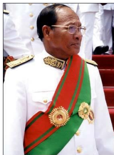
สมเด็จจ้อกรมหาพญาจักรี เฮง สัมริน

โดยประธานสภาแห่งชาติแห่งราชอาณาจักรกัมพูชา คนปัจจุบันคือ สมเด็จจ้อกรมหาพญาจักรี เฮง สัมริน (Samdech Agga Moha Ponhea Chakrei HENG SAMRIN) (ได้รับการเลือกตั้งกลับมาเมื่อ ๕ กันยายน ๒๐๑๘) จากพรรคประชาชนกัมพูชา (CPP)