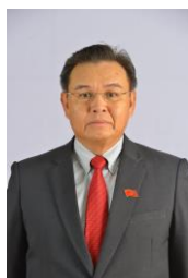
ประธานสภาแห่งชาติ ฯพณฯ ดร.ไซสมพอน พมวิทาน