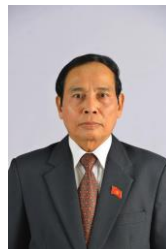
รองประธานประเทศ ฯพณฯ ดร.บุนทอง จิตมะนี