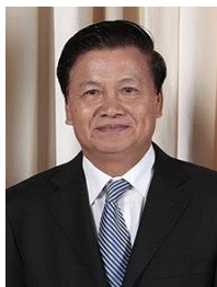
ประธานประเทศ ฯพณฯ ดร.ทองหลุน สีสุลิด