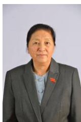
รองประธานประเทศ ฯพณฯ นางปานี ยาทอตู