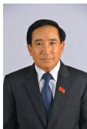
นายกรัฐมนตรี ฯพณฯ ดร.พันคำ วิพาวัน