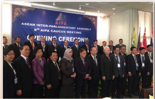
คณะผู้แทนรัฐสภาสมาชิก AIPA ถ่ายภาพเป็นที่ระลึกในพิธีเปิดการประชุม AIPA Caucus ครั้งที่ ๘

The afternoon session is the closing ceremony, the meeting acknowledged that the 9 th AIPA Caucus Meeting will be held at Indonesia. All leaders of the delegation from member parliaments attending the meeting signed in the report of the 8 th AIPA Caucus Meeting and had a group photo together. On Thursday, 11 August 2016, the delegation traveled to study under the topics of the meeting concerning with migrant workers and illegal wildlife trade. ■