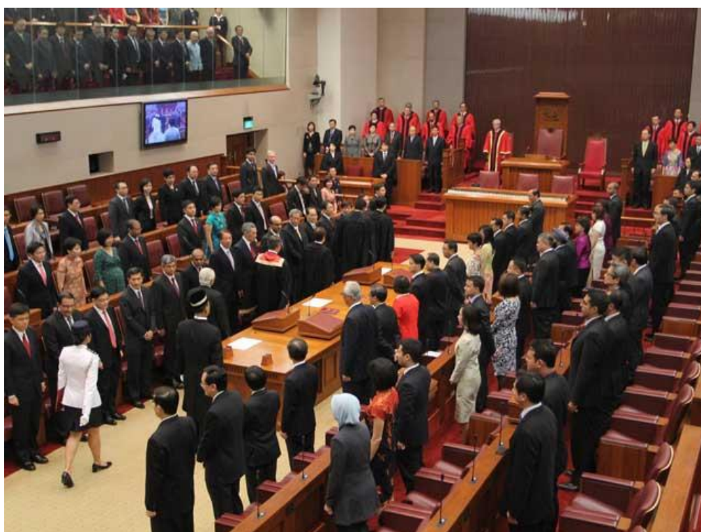
ภาพบรรยากาศในวันพิธีเปิดการประชุมรัฐสภานัดแรก

รัฐธรรมนูญกำหนดให้สมาชิกรัฐสภาเข้าร่วมประชุมไม่น้อยกว่า ๑ ใน ๔ ของสมาชิกรัฐสภาทั้งหมดเท่าที่มีอยู่จึงจะเป็นองค์ประชุมได้