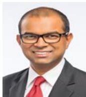
Dr. Janil Puthucheary ผู้ประสานงานพรรค (วิป) (Government Party Whip)