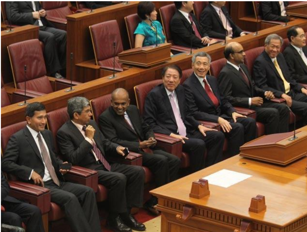
ภาพบรรยากาศของฝ่ายบริหารระหว่างการประชุมรัฐสภา

รัฐสภาสามารถทำให้รัฐบาลเป็นที่น่าเชื่อถือและไว้วางใจในการบริหารราชการแผ่นดินผ่านกระทู้ถาม โดยเปิดกว้างให้สาธารณชนได้ร่วมรับฟังมุมมองและความเห็นที่หลากหลายและใช้วิจารณ์ญาณพิจารณา ตัดสินใจในประเด็นที่อาจส่งผลกระทบต่อตนเองหรือไม่อย่างไร ซึ่งสิ่งนี้ถือเป็นบทบาทสำคัญประการหนึ่งของรัฐสภา