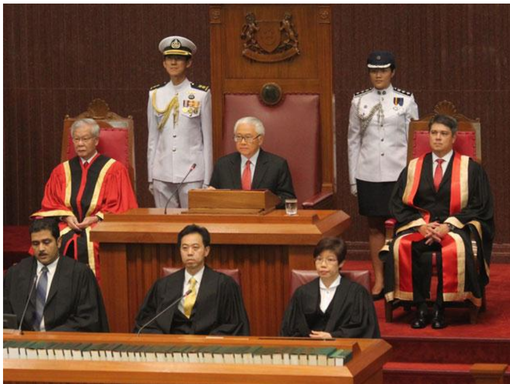
ภาพพิธีเปิดการประชุมรัฐสภานัดแรก

นอกจากนั้น รัฐธรรมนูญได้กำหนดกรอบอำนาจหน้าที่แก่สมาชิกรัฐสภาซึ่งเป็นสมาชิกที่มาจากระบบการแต่งตั้งโดยตรงจากประธานาธิบดี หรือสมาชิกที่ได้รับการแต่งตั้ง (แบบไม่ใช่เขตเลือกตั้ง) ซึ่งเป็นสมาชิก มาจากพรรคฝ่ายค้านที่พลาดที่นั่งในการเลือกตั้งทั่วไปแต่ได้คะแนนสูงตามเกณฑ์ที่กฎหมายกำหนดไว้ ซึ่งรัฐธรรมนูญได้บัญญัติกรอบอำนาจหน้าที่ของสมาชิกรัฐสภาทั้งสองกลุ่มนี้เหมือนกับสมาชิกรัฐสภาในระบบการเลือกตั้งโดยตรง เว้นแต่รัฐธรรมนูญได้ระงับการใช้สิทธิออกเสียงลงมติในวาระการพิจารณาในประเด็นที่เกี่ยวข้อง ดังต่อไปนี้