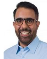
Mr. Pritam Singh ผู้นำฝ่ายค้าน (Leader of the Opposition)