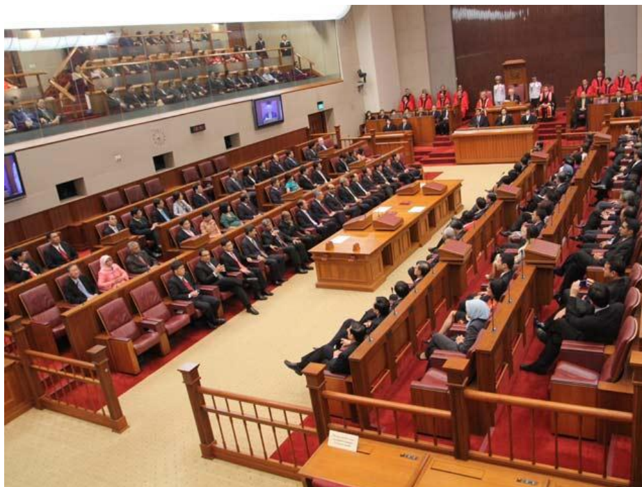
ภาพบรรยากาศการประชุมสมาชิกรัฐสภา

การเรียกประชุมสมาชิกรัฐสภาพึงกระทำได้ตามวันเวลาที่กำหนด หากเกิดกรณีจำเป็นต้องเลื่อนการประชุมหรือการเรียกประชุมที่นอกเหนือจากวันที่ระบุไว้ ให้การเรียกประชุมนั้นเป็นอำนาจหน้าที่ของประธานรัฐสภา