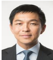
Mr. Tan Chuan-Jin ประธานรัฐสภา (Speaker)