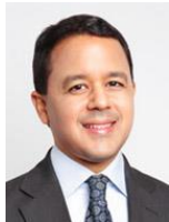
Mr. Christopher de Souza รองประธานรัฐสภา (Deputy Speaker)